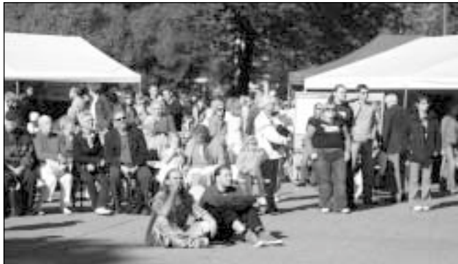
Maailmapäev toob Tallinnas Tammsaare parki kokku arengukoostööst huvitatud.

Koostöös Eesti Välisministeeriumiga korraldatakse kolmandat aastat järjest Eesti avalikkusele suunatud tasuta kogupereüritust Maailmapäev, mille eesmärk on tõsta Eestis elavate inimeste teadlikkust arengukoostööst, Eesti arengukoostöö