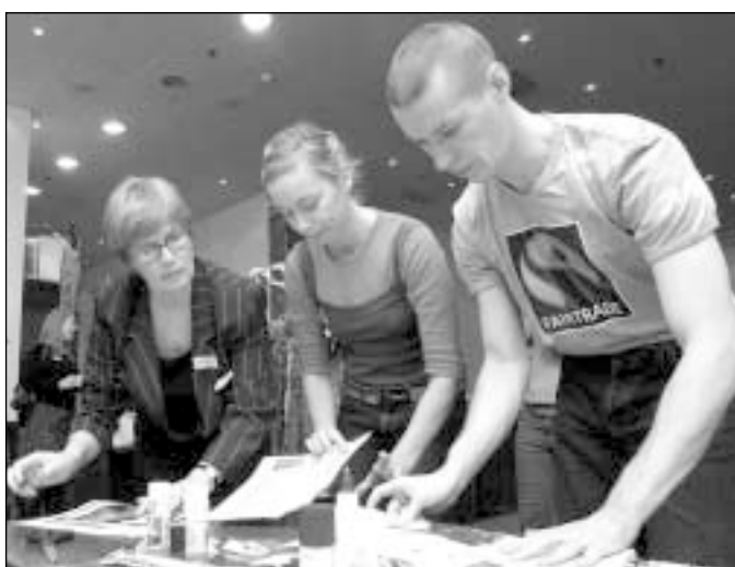
Elmises konverentsil õpetasid keskkonnaühendused muuhulgas vanapaberit uuesti kasutama.

Tänapäevastes ühiskondades ongi muutuste keskmeks head inimesed. Kõige olulisemad küsimused on sellised, mille lahendamises saab osaleda igaüks, kuid mida ei saa lahendada keegi üksi. Kes on