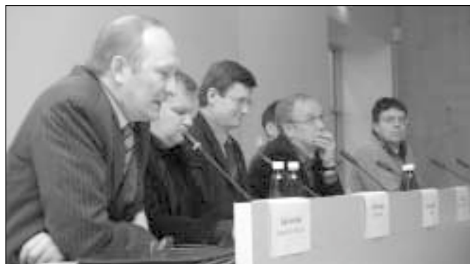
Üks näide poliitikute kaasamisest oli vabaühenduste valimiselne manifest, mida erakondadega arutati veel enne avaldamist. Veebruaris kutsuti poliitikud avalikule debatile oma seisukohti ütlemaks.