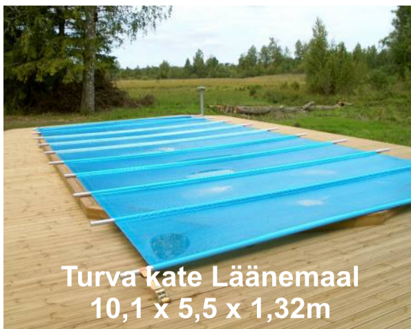
Turva kate Läänemaal 10,1 x 5,5 x 1,32m