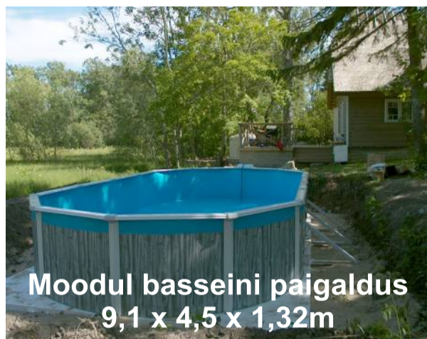
Moodul basseini paigaldus 9,1 x 4,5 x 1,32m