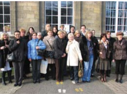
Töökohtumisel osalenud õpetajad

eri paigus annavad osavõtjaille uusi mõtteid ja ideid, lähendavad inimesi ning tutvustavad veel tundma- tuid maid. Ja algul õrvastust tekitanud konnakoivad maitse- sid lahkudes juba päris koduselt...