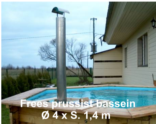
Frees prussist bassein Ø 4 x S. 1,4 m