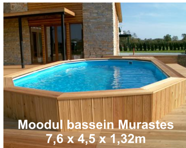
Moodul bassein Murastes 7,6 x 4,5 x 1,32m