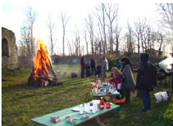
Töö ja lõbu käsikäes, teab Vääna rahvas. Talgute järel korraldati volbriöö eelpidustused.

Järgmise suurema üritusena korraldab MTÜ Vääna Külakoda 24. juunil jaanitule, mis toimub samuti Vääna mõisa juures. Jälgige informatsiooni meie kodulehel www.vaanakulakoda.ee. Seal