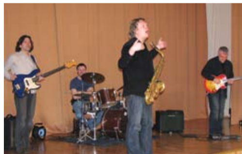
Eesti tippinstrumentalistid tutvustasid õpilastele mitmeid tuntuid džässmuusika varasalve kuuluvatest paladest.