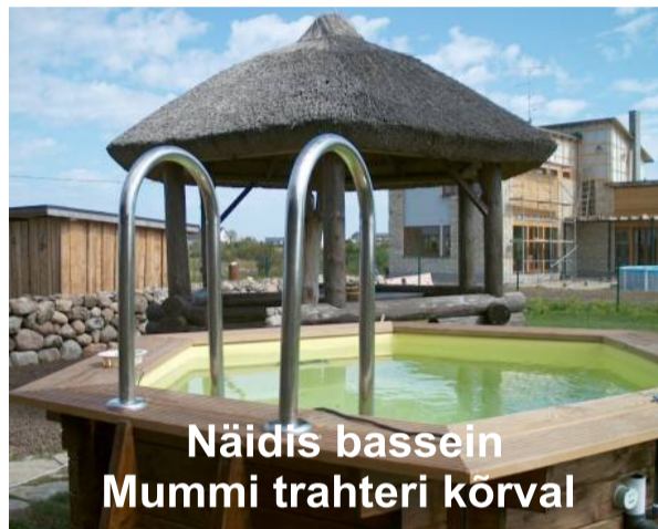
Näidis bassein Mummi trahteri kõrval