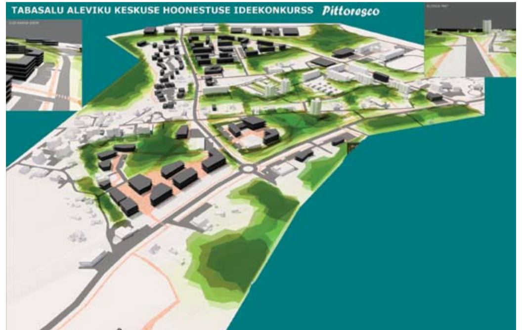
Sujuva liikluse tagamiseks soovivad võidutöö "Pittoresco" arhitektid rajada ringteid.

Žürii tunnustuse pälvis samuti liiklusskeemide lahendus kolme ringtee rajamisega põhimaanteele, välja on pakutud parkimismaja ja bussiterminali asukohad. Oma laienemisruum on ette nähtud ka tööstuspargile, kus juba praegu paikneb mi-