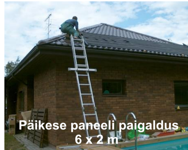
Päikese paneeli paigaldus 6 x 2 m

Väljasseinide ja katete aastaringne näitus Mummi trahteri kõrval Murastes (kolm basseini) Samas kõrtsitoas prospektid ja hinnakirjad. Tasuta konsultatsioon enne basseini ehitust