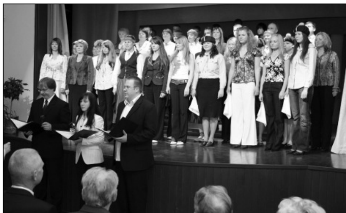
Õpilaste, õpetajate ja vilistlaste ühendkoor.

Fotod kooli aastapäevast tegi Taavi Melk. Vaata lisa http://www.taffman.eu/320/