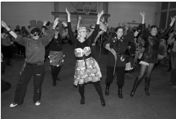
Õpetajate menukas etteaste.

Väikese vaheaja järel ootas vaatamist ja kaasaalamist Puhja Seltsimaja juubeliaasta lavastus „Rätsep Õhk ja tema õnne loos“.