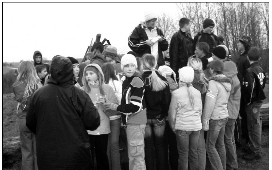
Auhindade loosimine oli matka vaieldamatult põnevaim osa.