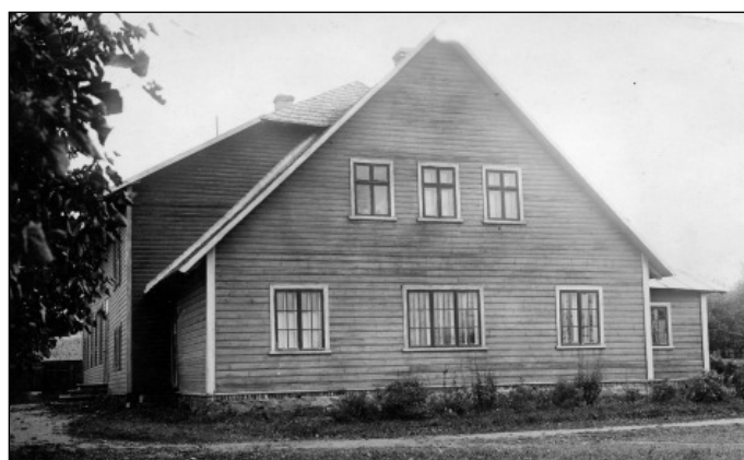
Puhja Seltsimaja, fotod seltsimaja arhiivist.

Sama aasta 5. märtsil tuli kokku esimene peakoosolek, millest aga halva ilma tõttu võttis osa vähe rahvast. Selts hakkas tegutsema – oli vaja tegevuskapitali. Otsustati korraldada pidusid ja näitismüüke. Ja selts ei töötanudki just kahjudega, kasumid kõikusid 1(!) kuni 100 rublani aastas. Sisseastumismaksuks määrati 2 rubla, mis olusid arvestades nii väike summa polnudki. Siiski sai selts oma jõududega muretseda orkestrile pille ja anda toetusi, peamiselt 10- rublaseid, mitmesuguste