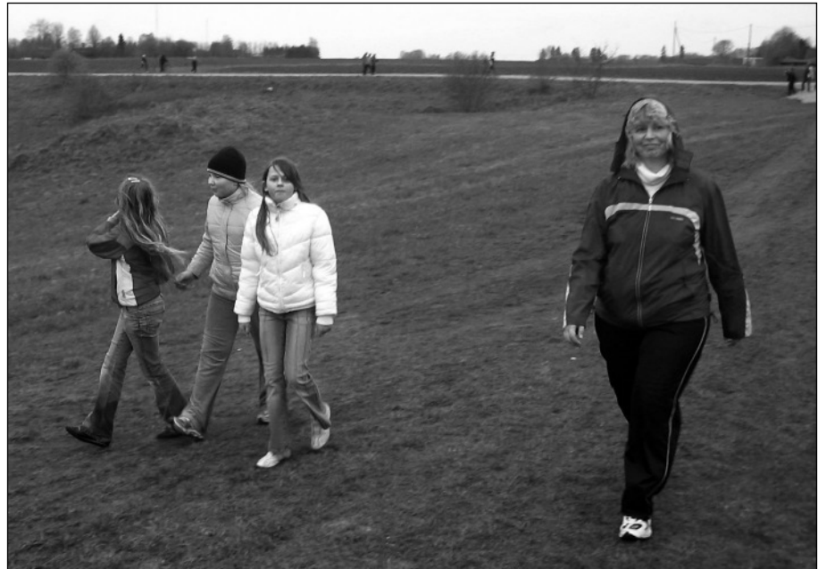
Matkajate rivi venis pikaks.