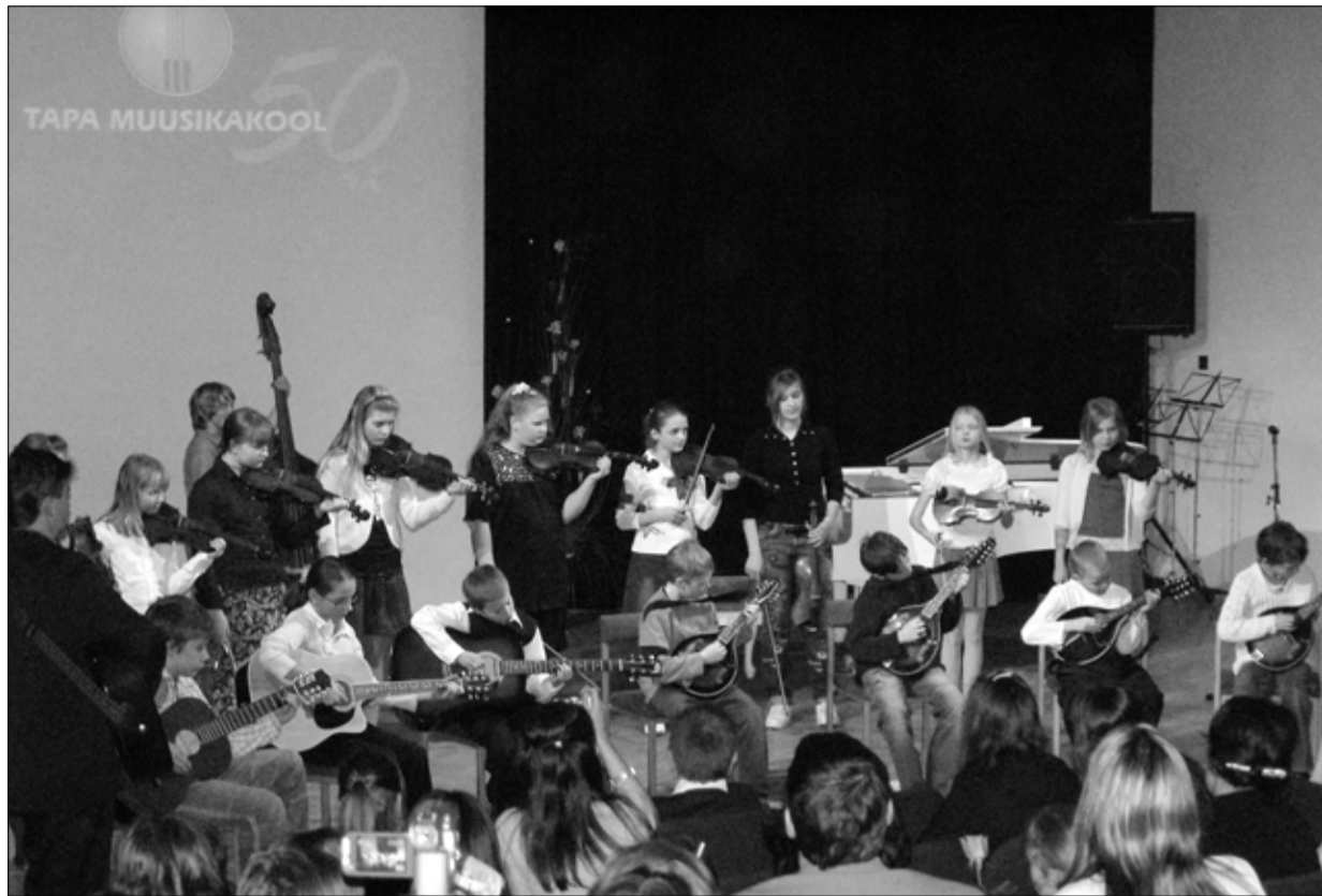
17. märtsil toimus kultuurikeskuses Tapa muusikakooli 50. aastapäeva kontsert-aktus, kus esinesid õpilased ja vilistlased. Muusikakoolis on saanud muusikalise algahriduse ligi pool tuhat tapalast.