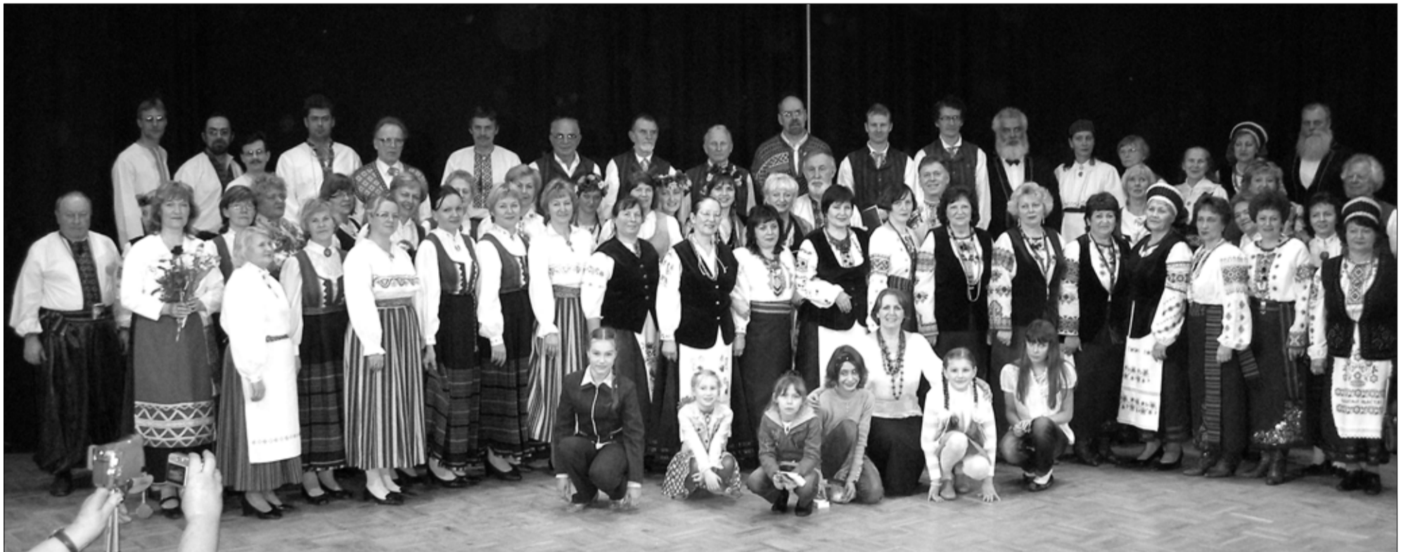
Rahvusgruppide minifestivalile Tapa kultuurikotta olid kogunenud erinevate kultuuritraditsioonide esinajad.