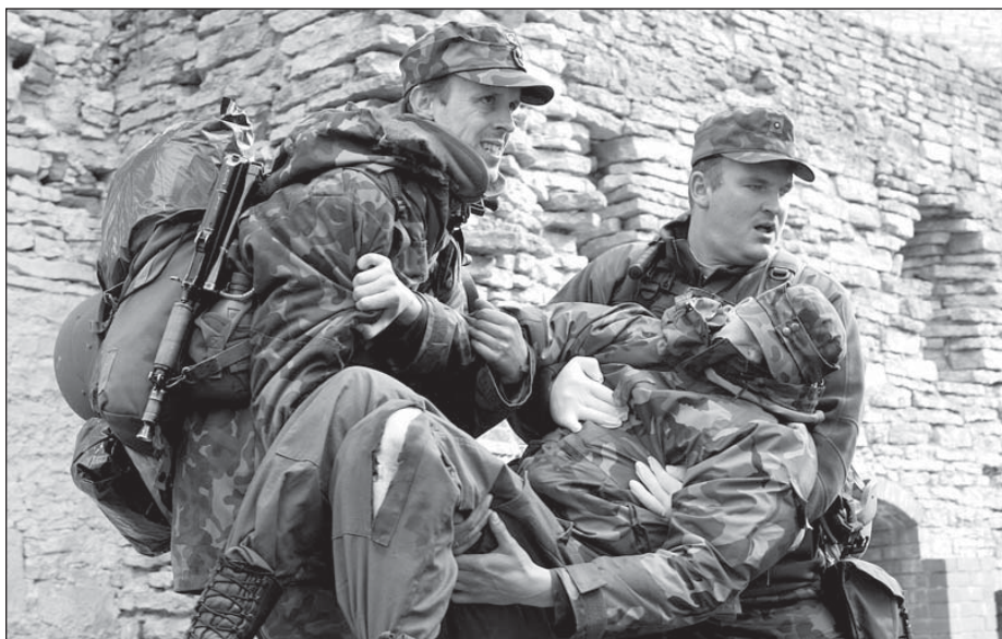
Murtud jalaga lahinguohver tuuakse ühisel jõul lahingutsoonist eemale.