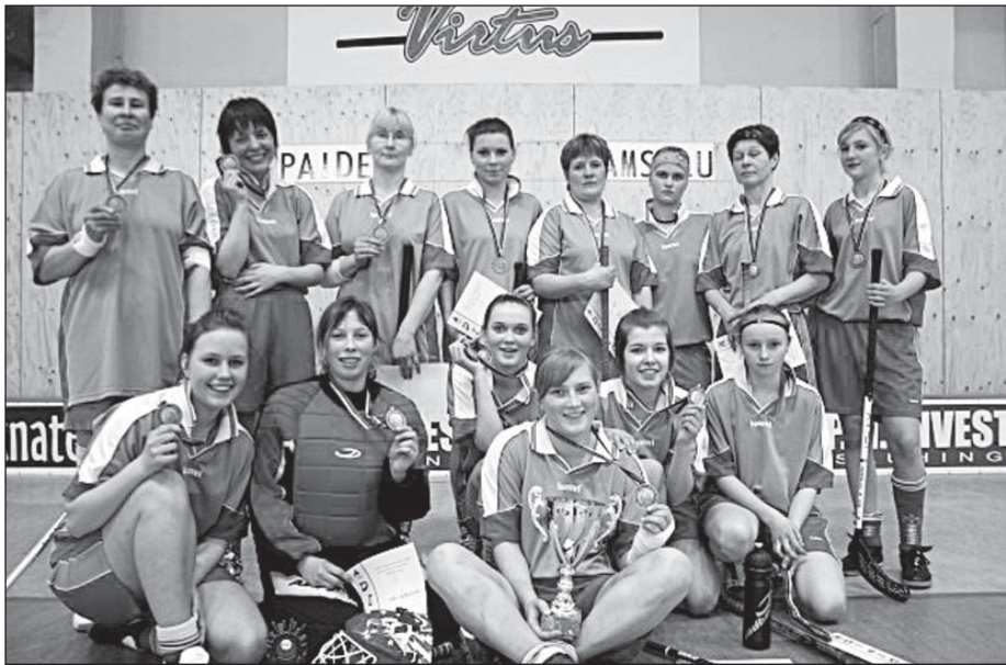
Järva ja Paide naistest mängivad Eestist paremini vaid kaks naiskonda.