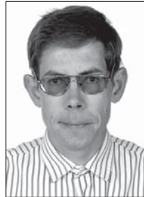
Anti Annus keskkonnaspetsialist

Kevade alguses pöörame linnas tavapäraselt suurt tähelepanu heakorradele.