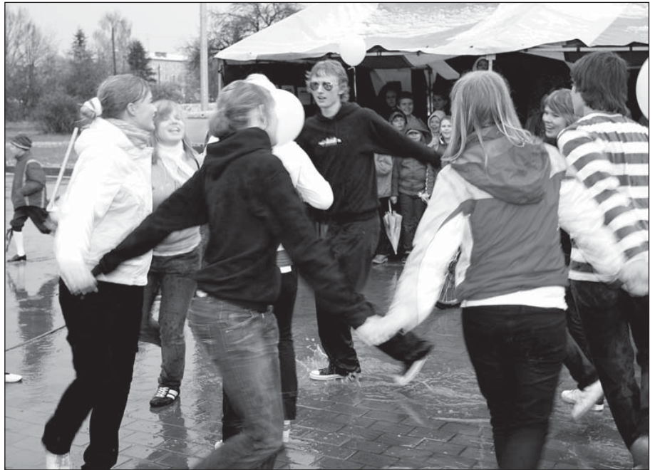
Noorte lustimist ilma vingerpuss segada ei suutnud.