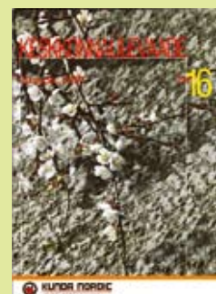
Kunda Nordic Tsemendi keskkonnanäprikke 2007

Osalejatele jagati KNT värsked keskkonnanäprikke, mida on võimalik saada KNT-st.