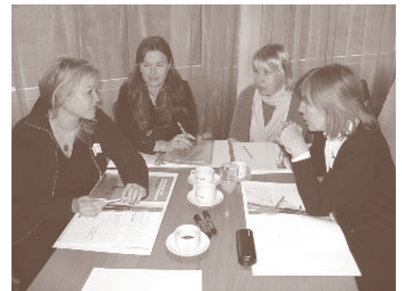
Koolitusel osalejad arutelubaos