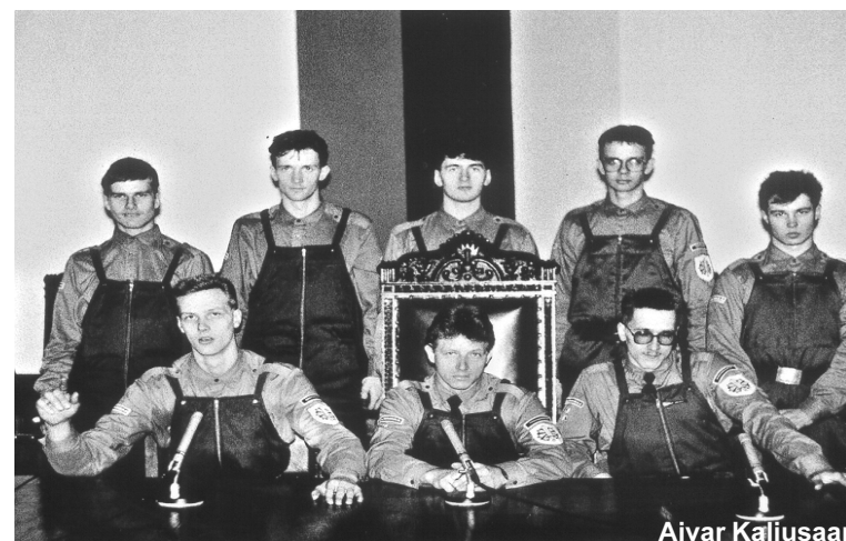
Toompea kaitsjad - piirivalvurid.

Tänu Eesti riigi tollaegsete juhtide hr Arnold Rüütli ja Edgar Savisaare targale, vaoshoitud, kiirele, kavalale ja otsustavale tegutsemisele jäi ahelveresaun Eestis toimumata.