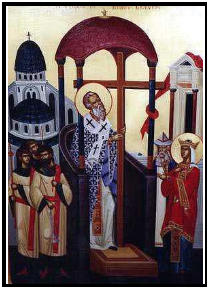
Kalli ja elavakstegeva Risti ülendamine