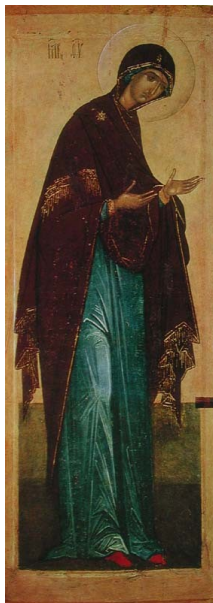
Jumalaema, Moskva XV saj