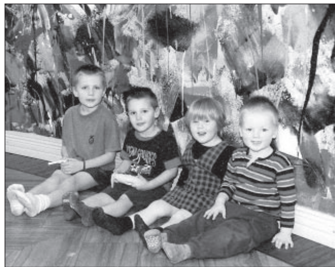
Nelja aasta jooksul on lastekodus viibinud 60 last.

Tänu Harjumaal omavalitsuste ja teiste sponsorite abile on lastekodus tööl abiõpetaja, arvuti- ja muusikaringi juhendaja. Regulaarselt kasutame psühhiaatri ja logopeedi teenu-