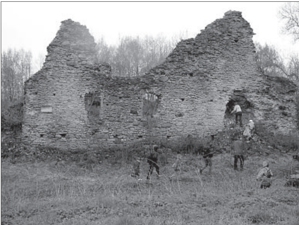
Rännumehed ronisid julgelt uurima, kus oli muiste elanike elupaigad, kus muldvalid ja kaitsekraavid.

gelt uurima, kus oli muiste elanike elupaigad, kus muldvalid ja kaitsekraavid. Rahvasuu räägib, et linnuse alt minevat salakäik Salutaguse mõisa alla.