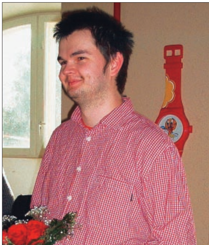
Kapa Rock 2003 peaesineja on Vaiko Eplik ja ansambel Ruffus.