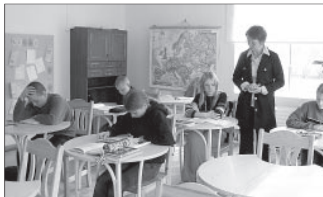
Kajamaa koolis arvestatakse õpilaste tegelikke võimeid.

Koolielu kulgeb Kajamaal kindlas rütmis - 45 minutit tund ja 15 minutit vahetund. Tunni lõpetab õpetaja klassi seinal tiksuva kella järgi, tunni kutsus kõiki saali ükselt korrapidaja-õpetaja. Vahetunni ajal klassiruumides ei olda, treppidele ei koguneta. Enamikul hommikutel võtab lapsi riiehoiust vastu juhataja, kellele lapsed saavad oma mure-