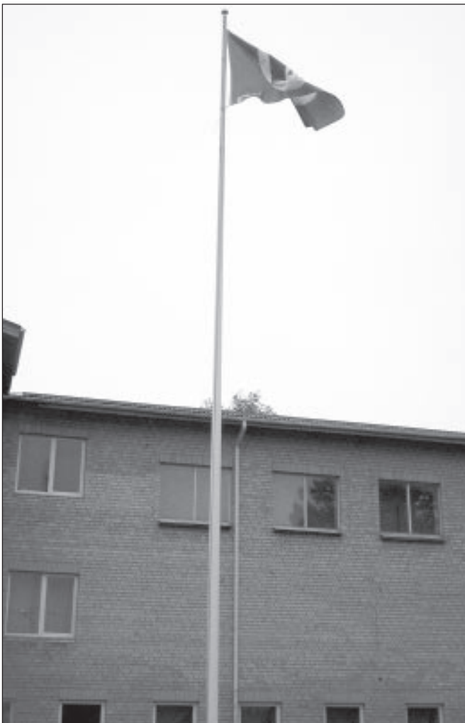
Kohila gümnaasiumi ees lehvib nüüd roheline lipp.