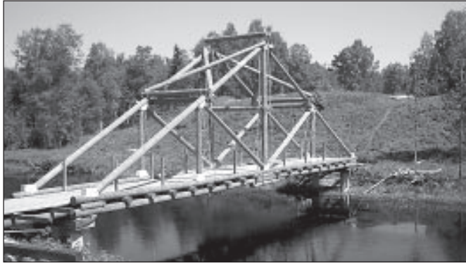
Loone linnuse sild peaks ehitaja arvates vastu pidama aastakümneid.

Silla paigaldamine ei läinudki nii lihtsalt, kui loodeti. Mõne tunni asemel võttis see