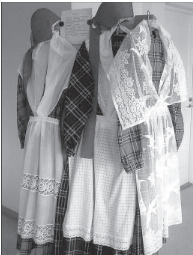
19.saj kanti Põhja-Eestis kaapotkleite

Hageri naine ei olnud kuigi uhkeldav. 18.-19. saj viimase veerandini kanti pikitriibulist kaharat seelikut, valget linast lihtsat särki, selle peal tumepruuni, hiljem potisinist pikka kuube. Abielunaine kandis linast põlle. Jõukam naine