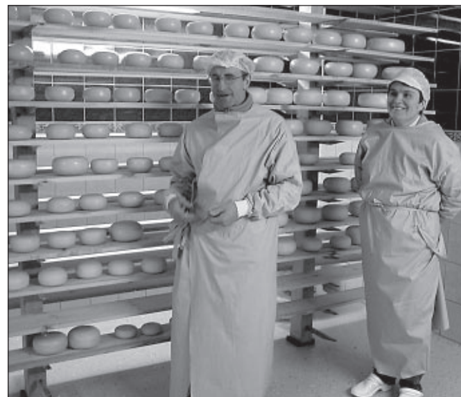
Esko talu Saku juustul on Tunnustatud Eesti Maitse märk.