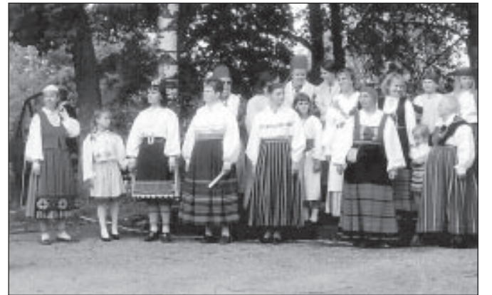
1998.a kihelkonnapäeval tutvustati Eestimaa piirkonnade rahvariideid.