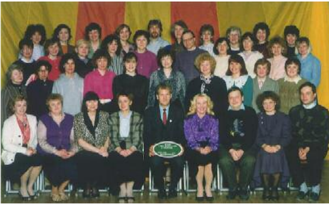
Õpetajate ühispilt aastast 1993