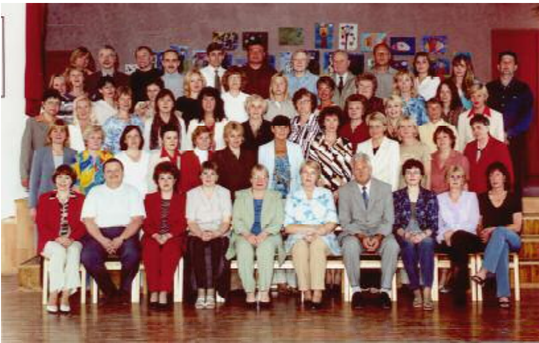
... ja aastast 2003