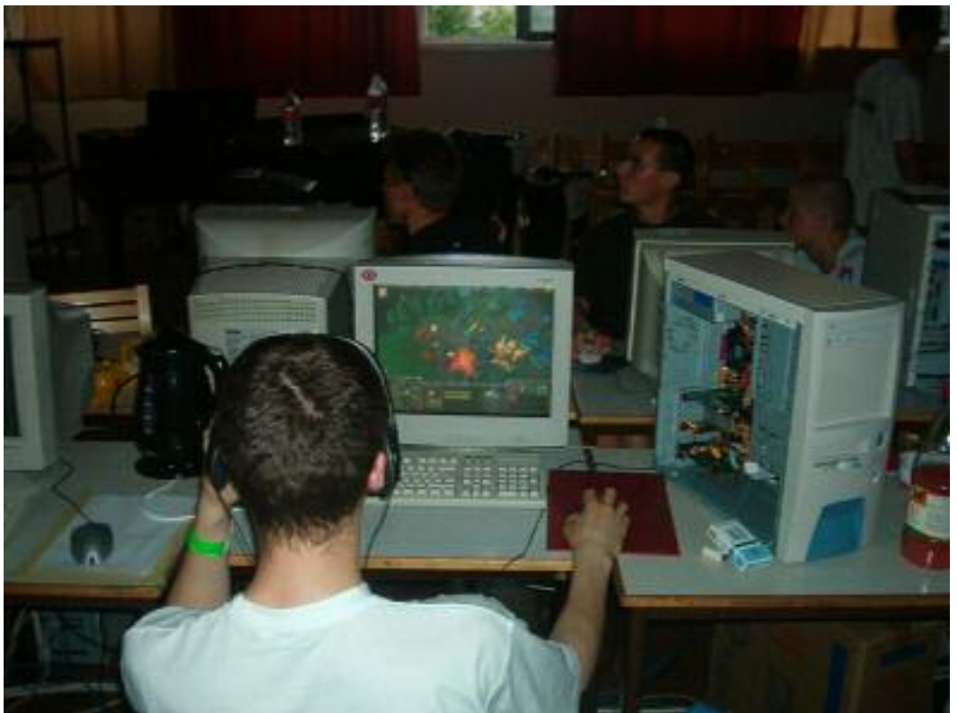
Ööpäevaringne võrgupidu - kas arvutisõltlaste pidu?

Kas kasutate arvutit igapäevaelu probleemide, abituse, süütunde, ärevuse või depressiooni eest põgenemiseks?