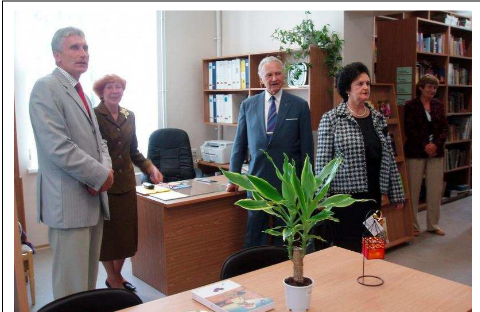
SOE JA SÕBRALIK VESTLUS: Härma raamatukogu renoveeritud ruume külastas piduliku avamise päeval ka president Arnold Rüütel.

Presidendipaar ja teda saatvad isikud külastasid tol päeval muuhulgas ka meie raamatukogu.