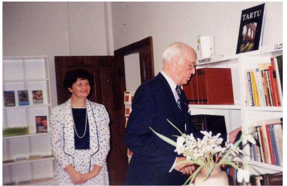
KIRJANIK JÄÄB KIRJANIKUKS KA PRESIDENDINA: Rannu raamatukogus siirdus Lennart Meri koheselt raamaturiiuli juurde.

Rahvamajaja jõudis president paaritunnise hilinemisega. Tema peatselt saabumisest andsid märkus kohale jõudnud turvamehed .... Ja siis ta tuli oma saatjaskonnaga. Väike värskendus kohvitas taga ja pisike taidluskava Rannu lastelt. Seejärel sai sõna president. Samuti vastas ta kokkutulnute küsimustele. Küsiti sedagi, kust saada raha rahvamaja lõpuni valmishitamiseks. Vastus oli lihtne: „Raha saadakse pangast ja teil ju panga uks siinsamas.“