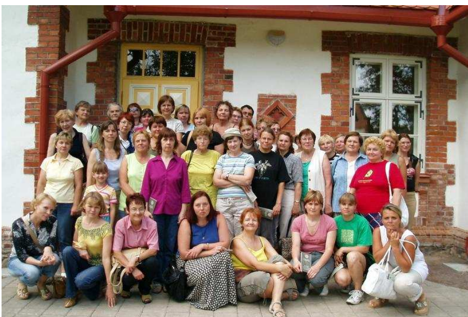
ILU MEIE ÜMBER: Tartumaa raamatukogurahvas poseerib hingematvalt ilusasse Luke mõisaparki taasrajatud kärneri maja ees.