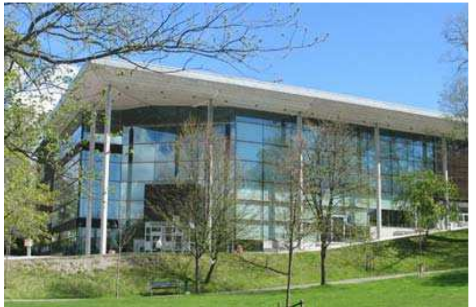
KOLM ÜHES TOIMIB NII KOOS KUI ERALDI: Hännösandi raamatukogu katusel all tegutsuvad nii teadus-, linna- kui maakonna keskraamatukogu.

Igasugusel koostegutsemisel on oma plussid ja miinused. Positiivne on, et ühelt tegutsedes on rohkem jõudu ja mahtu, ruumi, personali... Ratsionaalsemalt on võimalik kulutada raha, lahtiolekuajad on ühised. Aga nagu iga koostegutsemise puhul, kulub siingi iga probleemi läbiarutamiseks rohkem aega, keerukamaks võib osutuda majandamine, maja on küllalt suur ja raske hallata. Muidugi on ka teadusraamatukogul ja rahvaraamatukogul erinevad survegrupid. Kui algul olid hirmud, et kas piisavalt aktsepteeritakse rah-