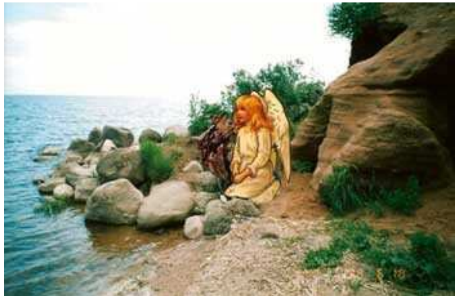
LEGENDI KÜTKEIS: Kallaste luulepäevale andis hinguse legend, et kunagi ammu puhkas Peipsi kaldal kivil üks ingel.