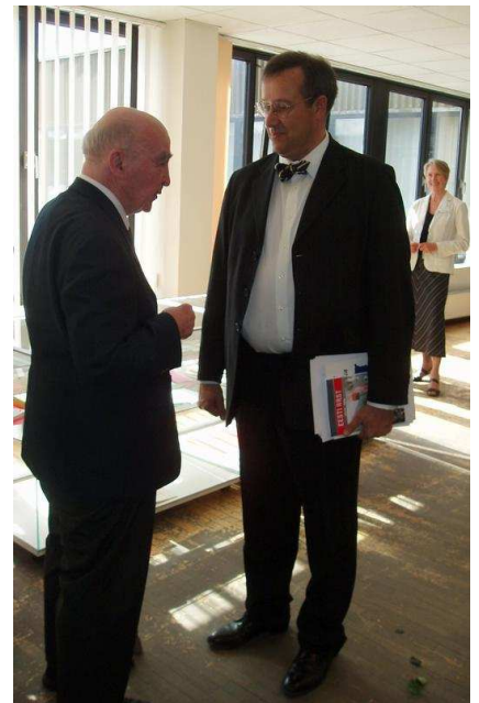
RAAMATUTEGA SINASÕBRAD: Auväärne ja hinnatud kirjamees Aina Kaalep on Toomas Hendrik Ilvesega ühel meelel.