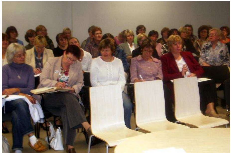
MÖTTETÖINE KOKKUSAAMINE ELVAS: Tänavusele lasteraamatukoguhoidjate päevale kogunes ohtrasti (67!) aktiivseid ja teotahelisi kolleege.