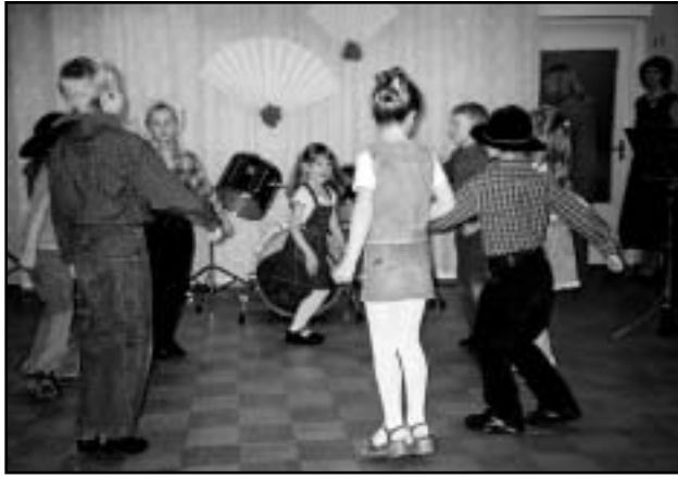
Tantsivad Vikerkaare väikesed kauboid.

Kakskümmend aastat mööda on läinud, lapsi sadade kaupa siin käinud. Nalja ja naeru täis olnud maja, nuttu ja jonnigi kostnud, kui vaja!