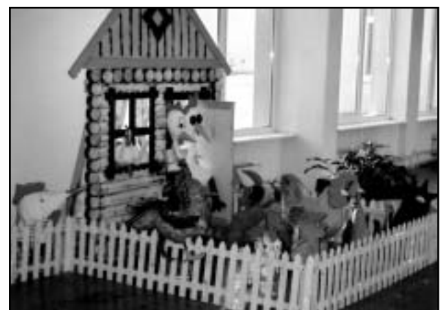
9. veebruaril algas puukuke aasta. Rāpina ÜG fuajees tervitavad teid laste valmistatud kuked.