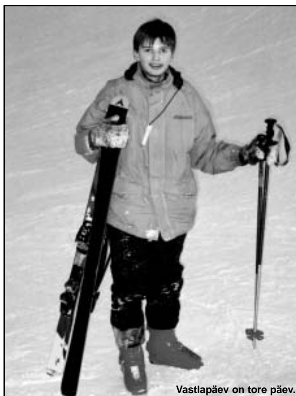
Vastlapäev on tore päev.