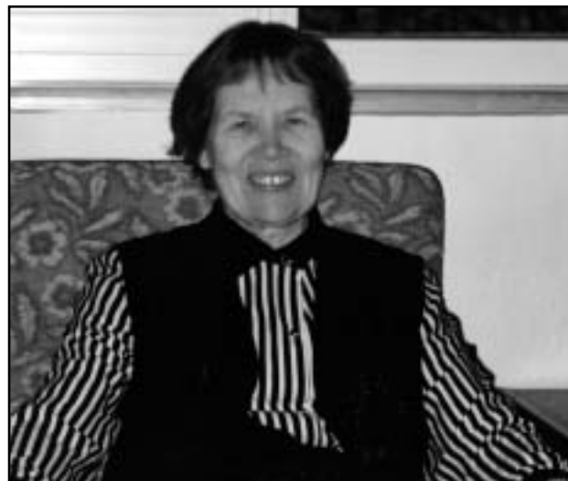
Puhkehetk õpetajate toas.