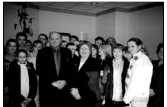
Oma klassiga vallamajas külas käies kohtusime ka Kilingi-Nõmme Linnavalitsuse liikmetega.