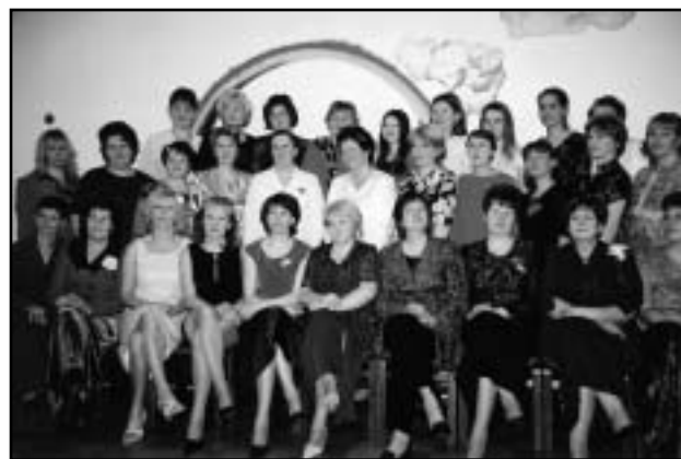
Vikerkaare kaunis ja töökas kollektiiv.