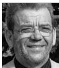
Vambo Kaal vallavanem

Maailmas ei ole absoluutset tõde, veel vähem üheseid lahendusi. Kiili vald on kiirelt arenev, mis omakorda nõuab suuri muutusi. Mida rohkem on informatsiooni ja eriarvamusi, seda suurem võimalus on püsida õigel rajal.