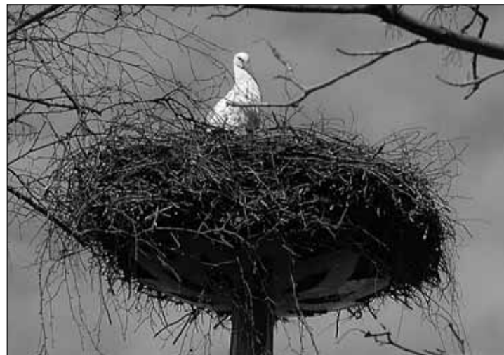
Aprilli algul asustati Rahvamaja kõrval asuv kurepesa.