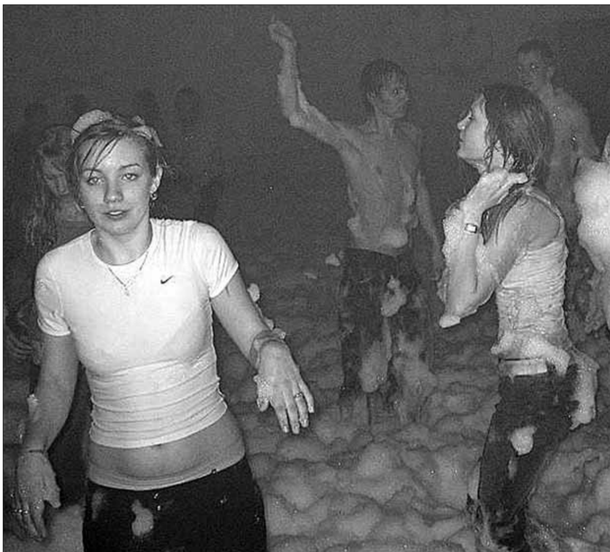
Korraldajate sõnul ei jäänud tantsupõrand hetkekski tühjaks.

Saal oli jagatud kaheks – ühe poole teemaks oli põrgu ja teise, kuhu vahtu lasti, taevast. Mõlemad pooled olid vastavalt dekoreeritud. Nii võisid külastajad valida kuiva ja märja poole vahel, sest vahus sumbates läksid riided märjaks.