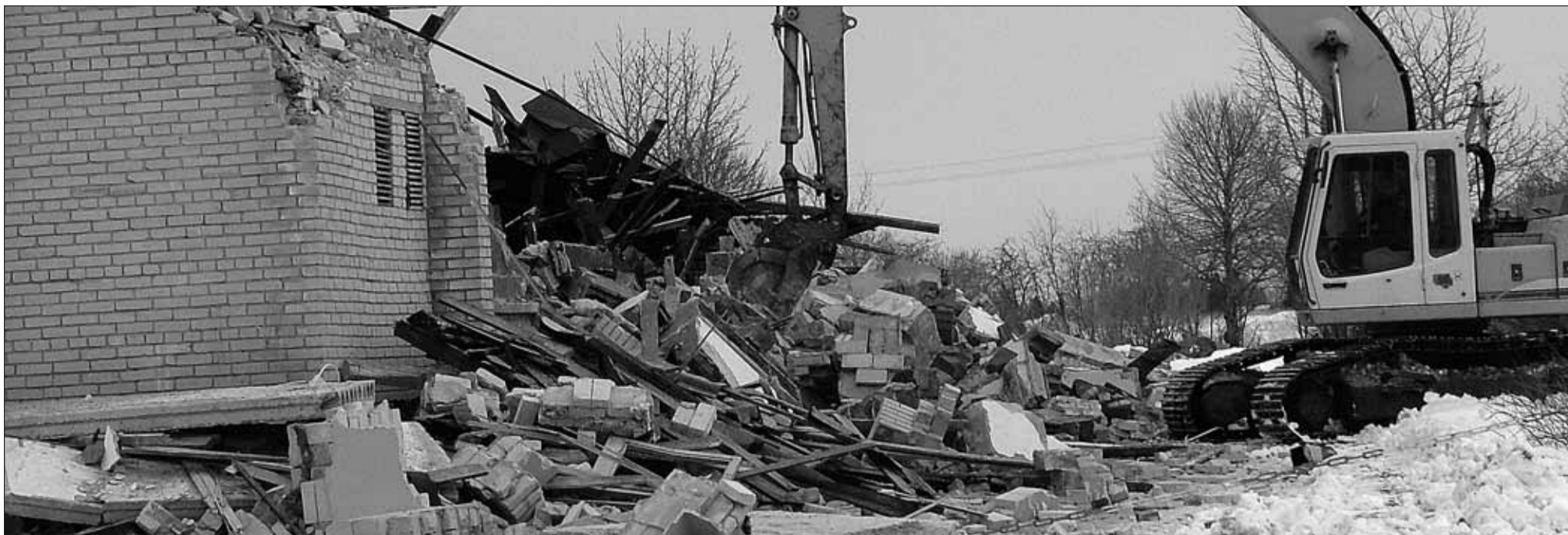
Ühes otsas lammutatakse, teises ehitatakse uut juurde. Hetk vana spordihoone lammutustöödest – kopp on suurema osa hoonest juba rusudeks muutnud.