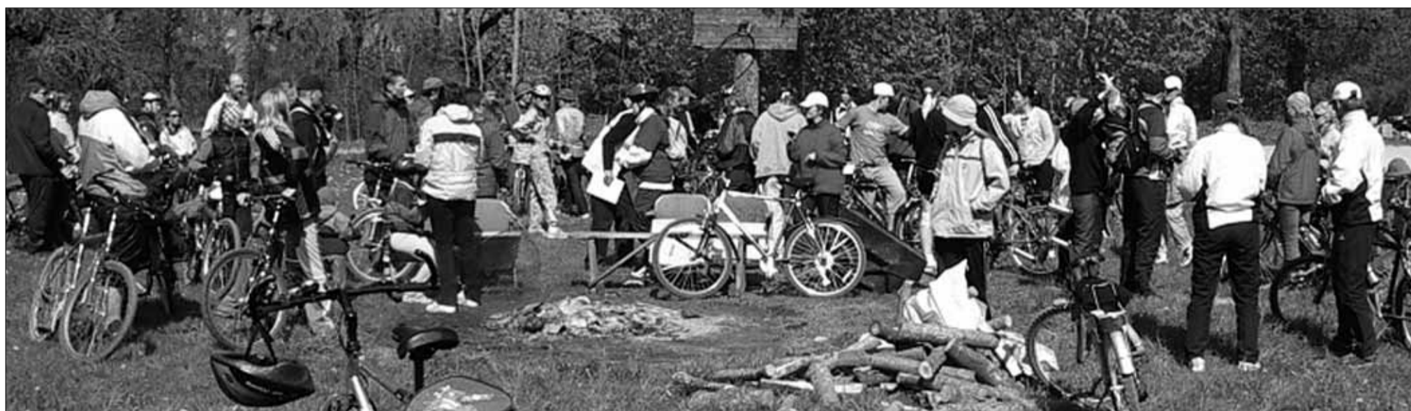
Fotomeenus eelmise aasta jalgrattamatk Kiili vält 2004.

Järgmiseks noorteklubi poolt organiseeritavaks ürituseks saab Kivi sõnul klubi esimese sünnipäevapeo korraldamine. KL