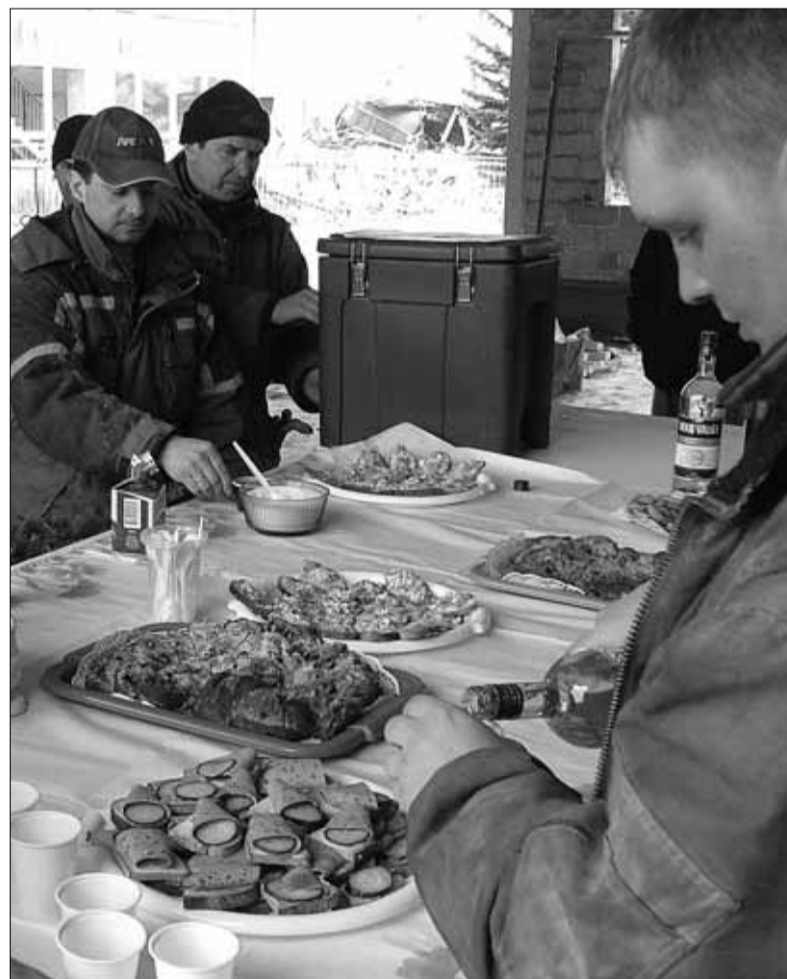
Sarikapeol kaeti ehitusmeestele kombekohaselt laud suupistetega.