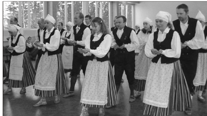
“Loits” end Viljandis Üldtantsupeo korraldajatele ette näitamas

Esimene ülevaatuuste voor on selja taga.