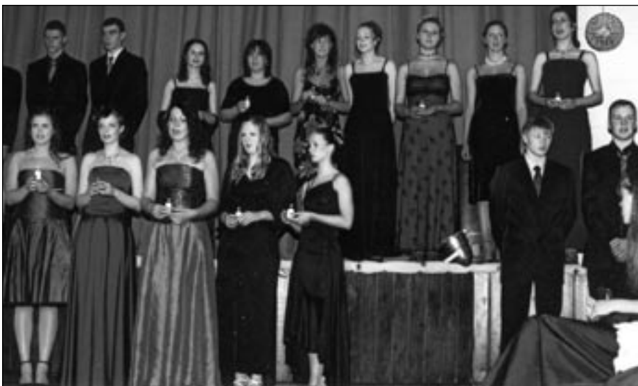
Abituriendid luulepõimikut esitamas