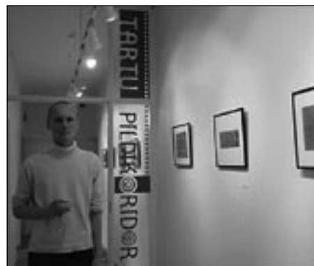
Kunstnik Mika Turkia

Mika Turkia (s.1972, Helsingi) põhjapõdrapiltidel saab see põhjamaine koduloom müstilised jooned. Lapimaal on põhjapõder igapäevase leiva teenimise vahend, Lõuna-Soomes tuleb tal aga vedada urbanistliku loodusigatsuse rasket rege. Turkia piltidel on loodus tükeldatud ja sobitatud lõuna esteetilise maastikuga. Lapimaa on soomlase jaoks omamoodi teispoosus - koht, millest unistada ja kuhu igatseda. Samas toodab see igatsus tänapäeva Lapimaale järjest enam disneylapse ja turistide karpkülasid.