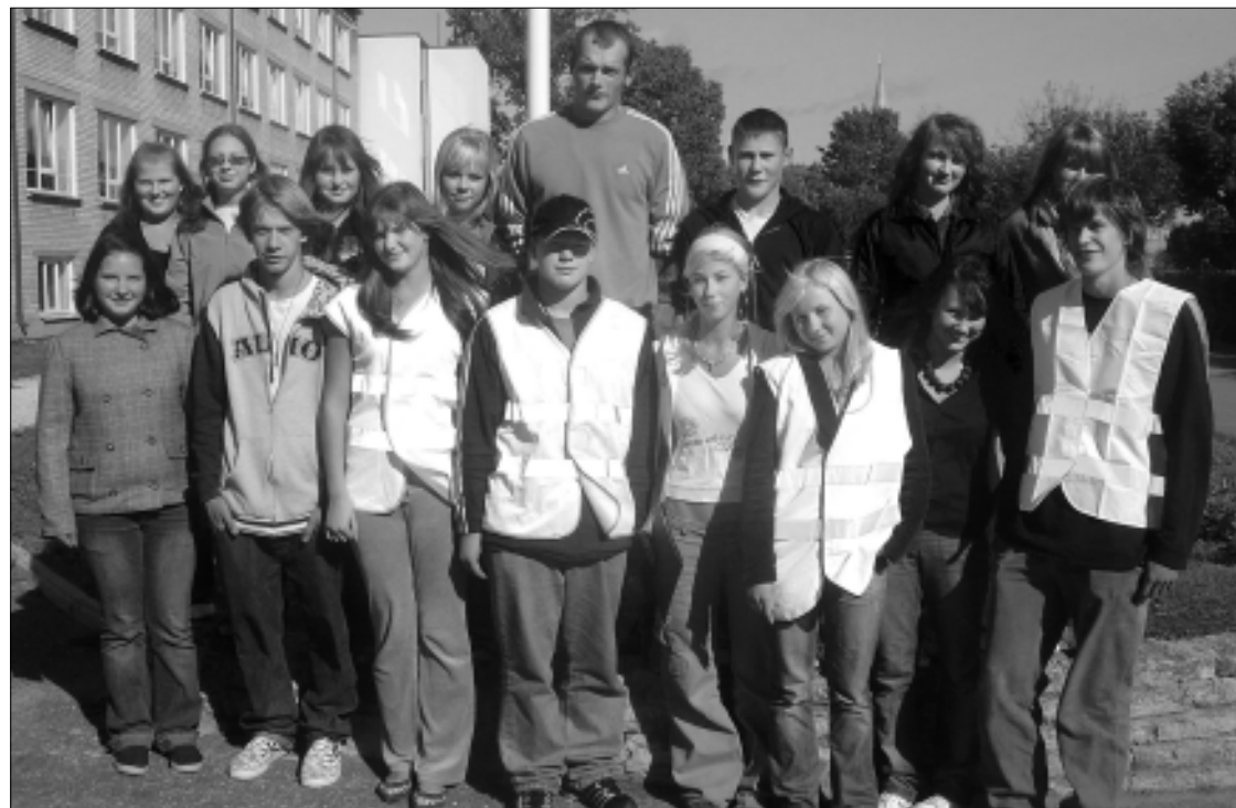
Tapa gümnaasiumi noored sebravalvajad ühispildil pärast edukat tööpäeva.