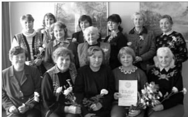
• "Höbeniidi" naisansambel – 20.