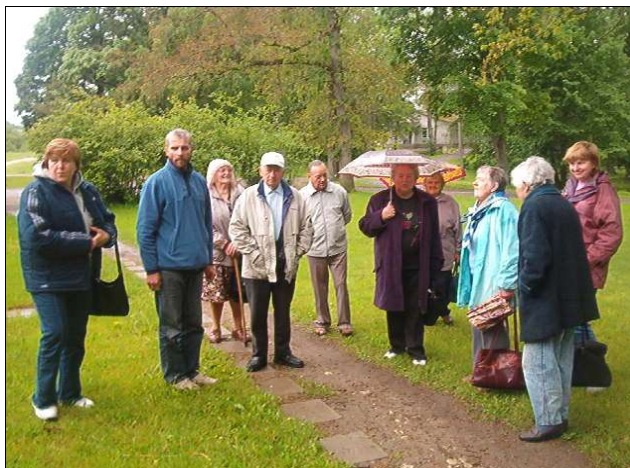
Kokkutulnud Kodila pargis