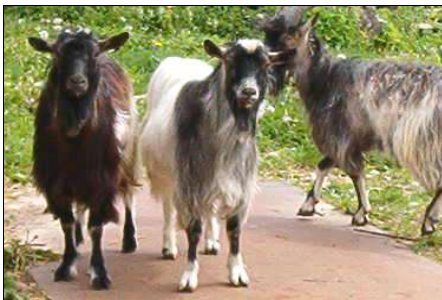
Kaiust, Eevi Pajuri käest ostetud eesti maatõugu kitsed olid nõus poseerima aga Tallinnast toodud Kameruni mägiääbus- kitsed jäid kaameraulastusest välja

Jaani kutsus oma ostu uudistama ja tõepoolest kuus iseliikujat vaatavad üle aia vastu, niiduaparaadi lõikelaiused küll lühikesed, aga kui nad korralikult kõrvuti seada, pügavad paraja tee kor- raga sisse. Mõnel niidukil veel uhked hangud küljes.