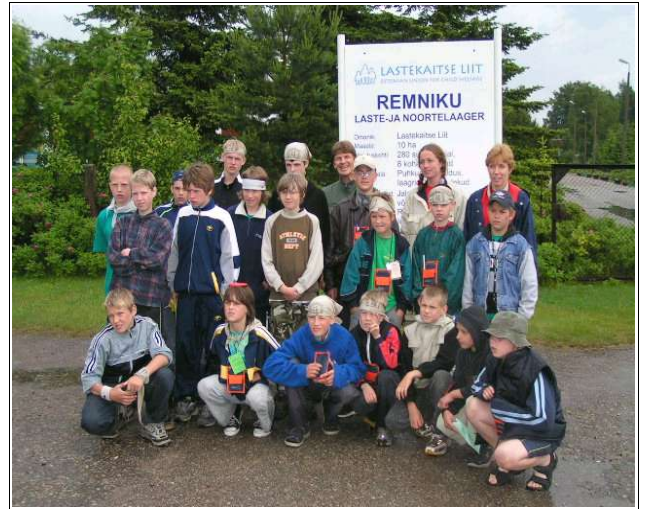
Rapla maakonna seiklejad