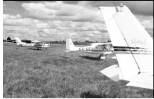
Lennukite perroonil seisid mitmed võistlustel osalenud väikelennukid.

“Külgtuul oli piiripealselt tugev ja tulemused polnud laita,” hindas