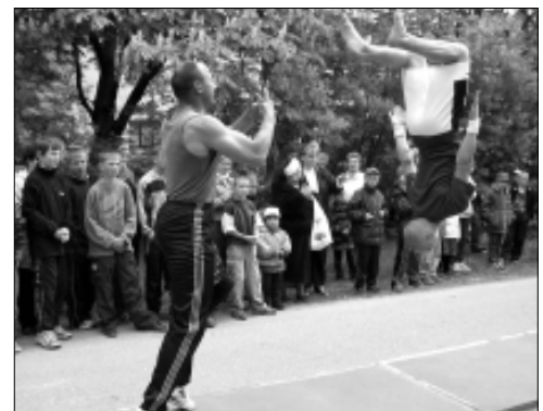
Tapa erikooli akrobaadid esinesid lastekaitsepäeva üritusel huvitava ja osavustnõudva kavaga.

Lastekaitsepäeva tähistamine on kujunenud Tapal üheks traditsiooniks. Nii kogunes sellel aastal esimesel juunil lastekeskuse juurde palju lapsi koos oma vanematega. Lastele on tähtis, kui tema rõõmude maailmas elavad temale kõige lähedasemad ja armsamad – oma vanemad. Tegutsimisrõõmu ja põnevust jätkus kõigile, sest tegelikult elab ka suurtes inimestes edasi lapsepõlv. See ei lõpe täisealiseks saamisega. Täisealisus tuleb vaid lisaks – peale, alla, kõrvale ja sisse.