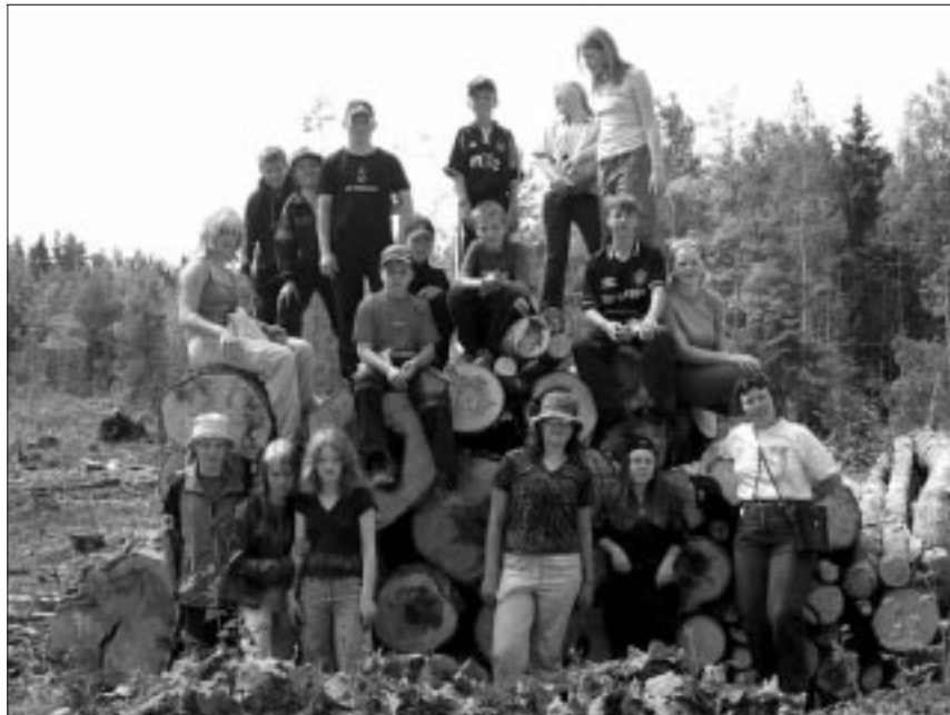
● Looduslaagrist osavõtjad on teel rappa.