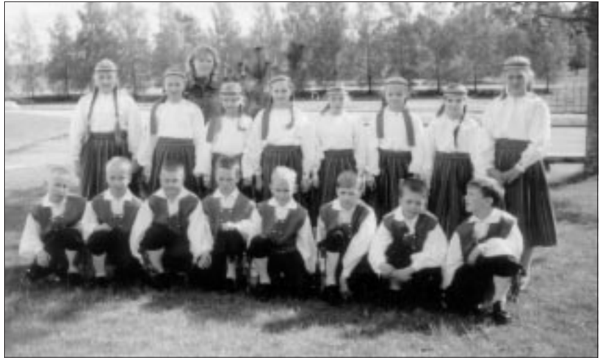
● Kõik need lapsed õpivad Kalmetu kooli kolmandas klassis.

Endel Jõgi 17. 07. 34 – 12. 06. 04 Viiratsi alevik