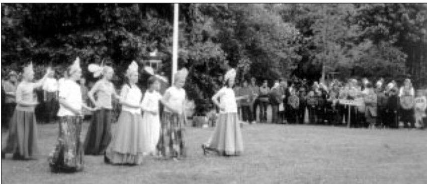
● Avatseremoonia kultuuriprogrammis esines ka Venemaa. Alumisel fotol astub üles aga Nigeeria.

Neid külalisi kehastasid Viiratsi Algkool ja Viiratsi Lasteaed.