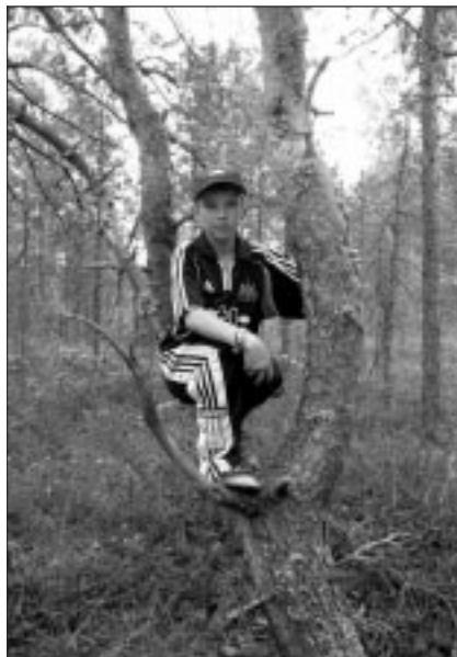
● Tenno Vallile meeldis huvitav haruline mänd, mille otsa oli mõnus ronida.