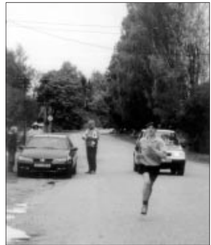
● Jooksjad viisid olümpiatule läbi valla Kalmetule.