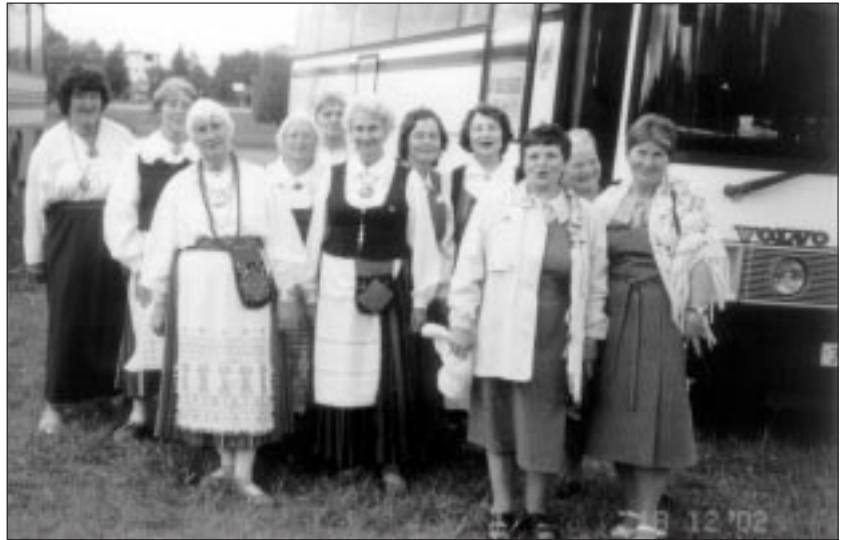
● Viiratsilased memme-taadi peol Intsikurmus.