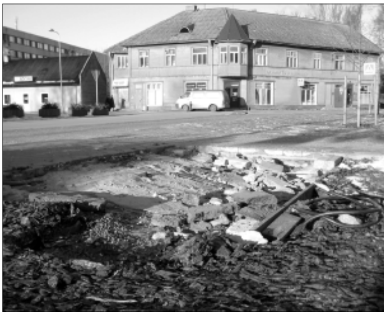
Sel nädalal lammutati ja viidi ära keskväljaku ääres seisnud R-kiosk. Maha jäi vaid veidi prahti ja elektriablid. Linnavaade aga muutus avarmaks.