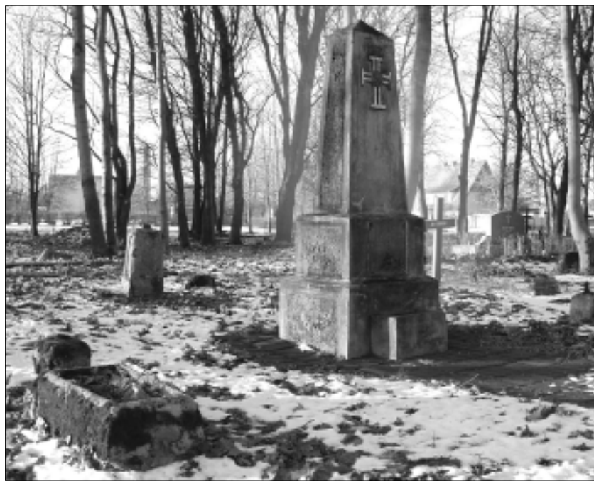
Tapa vanal kalmistul asuv Vabadussõja taastatud hauasammas.