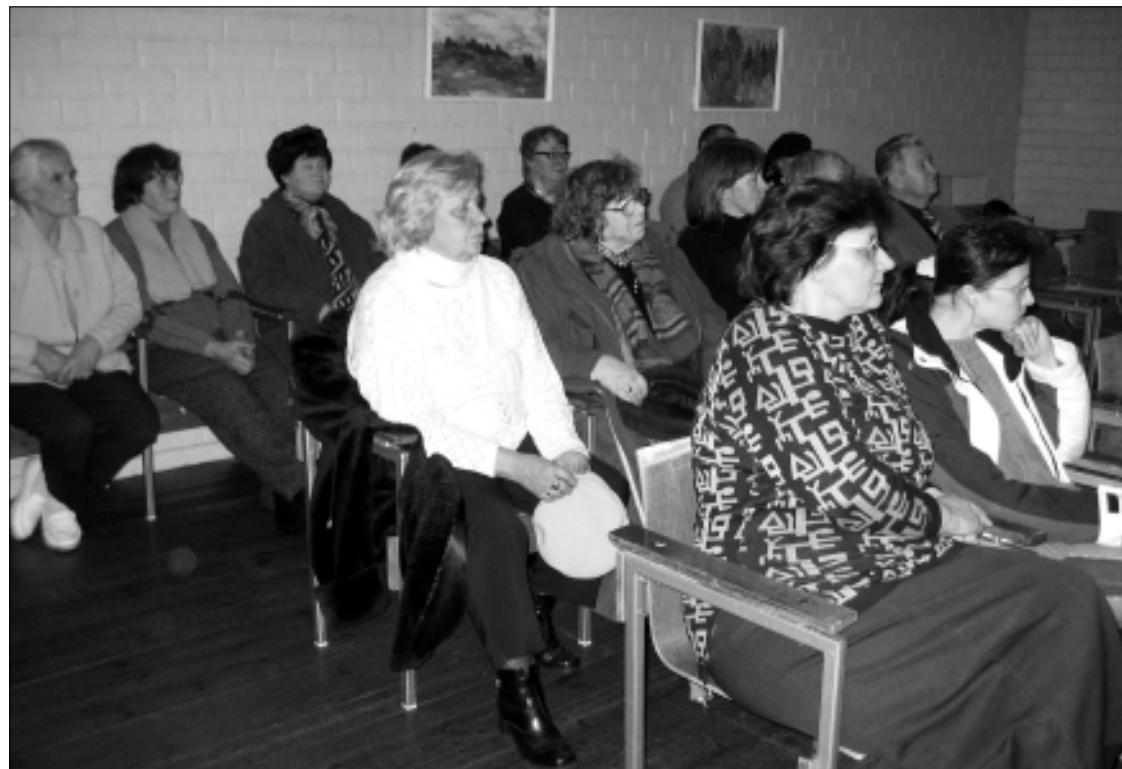
Jäneda põhikooli saali oli vallaametnikega kohtuma kogunenud üle 20 huvilise.