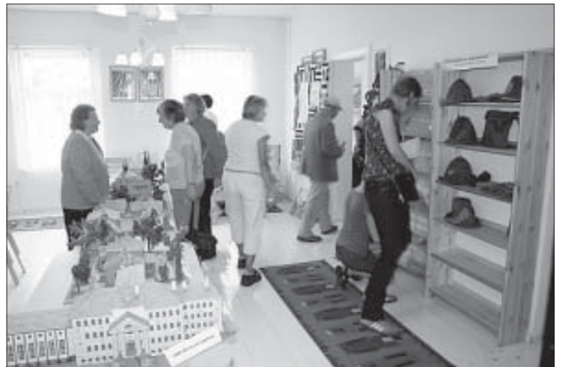
Käsitöönäitus Allikukivi raamatukogus.