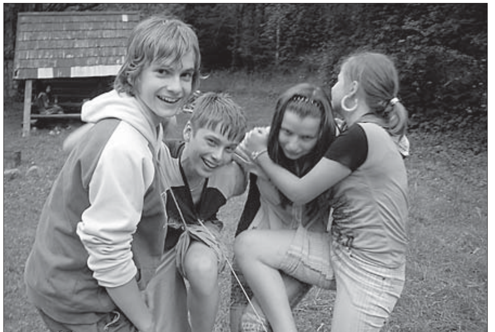
Üks kõigi, kõik ühe eest.