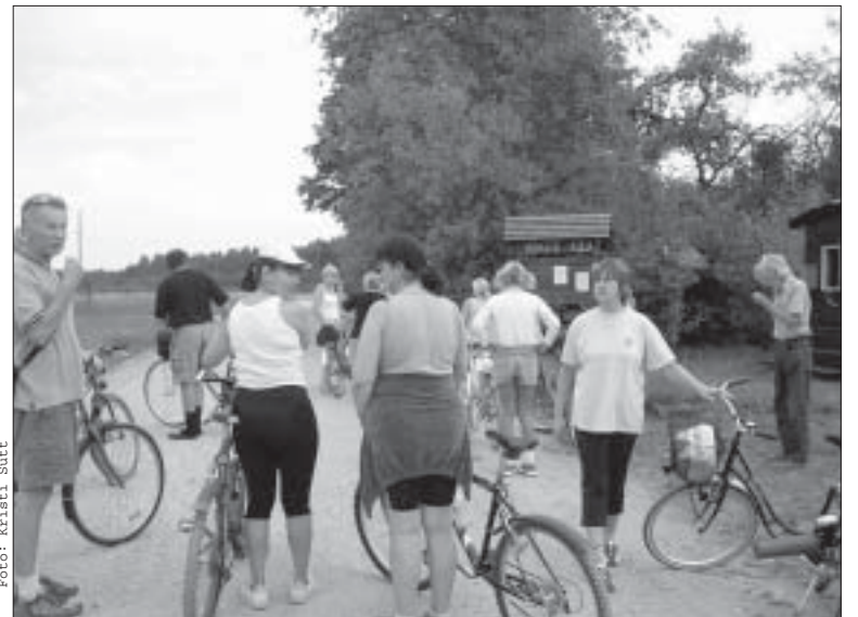
Puhkepaus Sigaste külas.

sellest saime ka kuulda, kuid endisega võrreldes on see hale vari. Kurb vaadata. See on 15 iseseisvusaasta negatiivne tulem, mis meie metsameeste linnakesele raske mõista ja taluda. Jääb vaid loota, et Marana uued omanikud ükskord siia taas elu sisse puhuvad ja