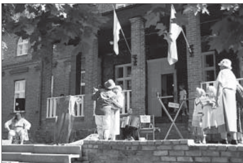
Ehk armastus Voltveti moodi.