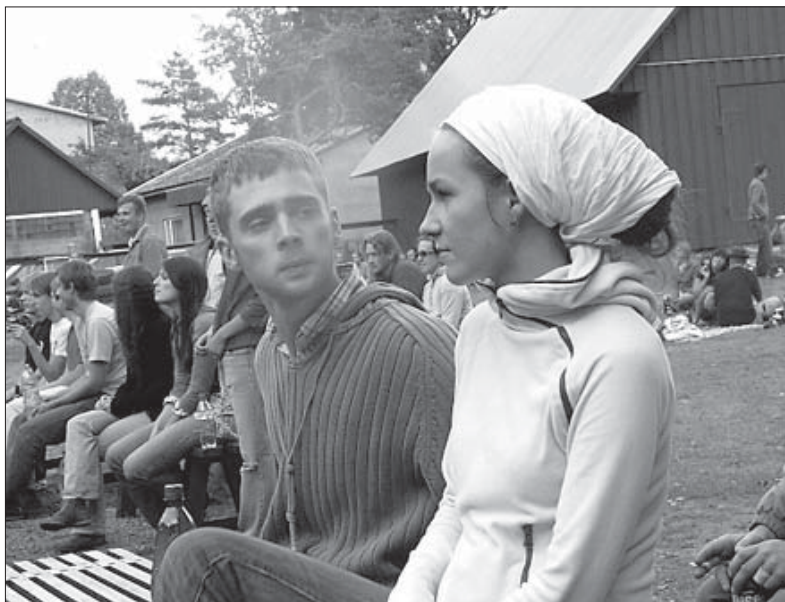
ja ilus publik.