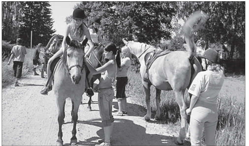
Põgene vaba laps...