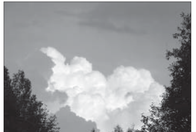
Äikesepilved kogunemas Kanaküla metsade kohal.

Ennekõike vedas nina-pidi ennustajaid. Loodusmärkide järgi pidi tulema jahedapoolne, piisavalt saju-ine ilmastik. Aga võta näpust! Oli mitte ainult vihmata, vaid ka enneolematult kuiva õhuga. Lausa kõrbe-kliima, meie tavalise 60-70% õhuniiskuse asemel 20-30% ja mõnikord alla selle. Metsa-, kulu- ja maastikupõlenguid on seniseks loendatud üle 6000, lisaks veel viljakoristamisel süttinud põllud. Vihma said tänavu üle Eesti vaid valitud paigad. Hoogsajupilvede tekkimine pole ettearvatav, pealegi peletas kuumust õhkav maapind igasuguse pilvituse laiali. Eks seepärast, vastupidi tavalisele, sadas sel aastal rohkem rannikul ja merel. Sisemaal kiratsesid põlluvili ja rohukasv põua käes. Päikest sai aga näha poole võrra rohkem kui muidu. Päevitamise mõnudele seadis piiri päevane palavus ja kogu suve jooksul kõrgena püsinud ultraviolettkiirgus – indeks üle kuue. Kuskilt oli kuulda, et Baltikumi kohale on tekkinud osooniauk?