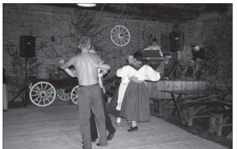
Algab trall suhkruaidas.