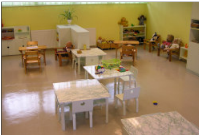
Vaade lasteaia ühele remonditud rühmale

20.-21. augustil käisid lasteaia töötajad oma uut tööaastat alustamas ja uut energiat kogumas Saaremaal. Küllastasime Sandla ja Kärla lasteaedu maakonnas ja Kuressaare Kesklinna Eralasteaeda ja Kuressaare Eralasteaeda "Kõige suurem