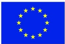
Toetab Euroopa Liit