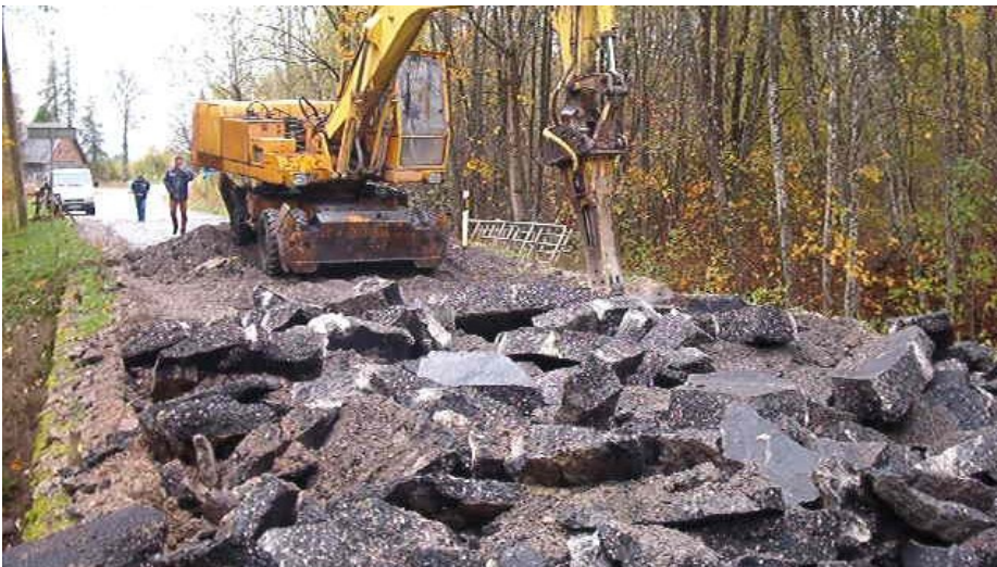
Nii nägi sild välja kolmandal päeval.