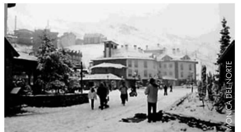
Lumine Monachil asub Lõuna-Hispaanias Sierra Nevada mägedes.