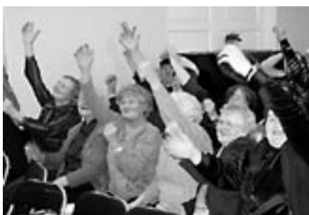
Harjutusi tehti aktiivselt kaasa.

Kuna tähistasime tervisepäeva, oli kaasa toodud tervislikku pune-, naistepuna-,