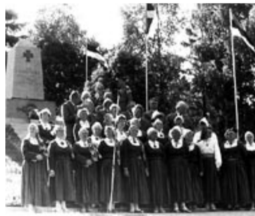
Vabadussõja ausamba juures esines kultuurimaja segakoor.

Kõik see, millega tookord toime tuldi, tundub tagantjärele uskumatu, ent on ometi tõi. Paljud endised otepäälased vägagi kaugel, näiteks USAst ja Austraaliast olid seda kõike tunnustamas.