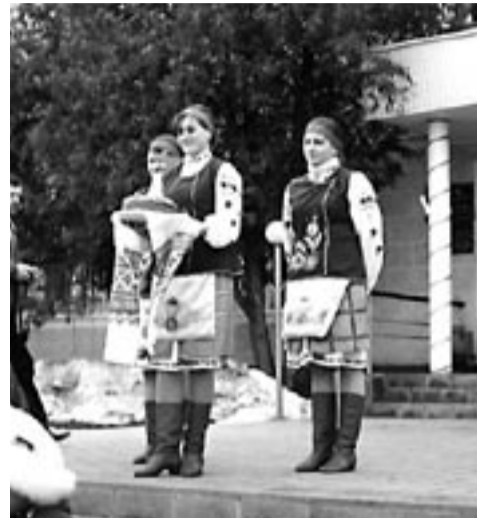
Külalisi Eestist võeti vastu soola-leivaga.

Grivna on Ukraina rahaühik, mille nimi tuleb vanast hõbedakangikese nimetusest, mille