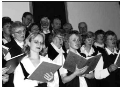
Juba kolmandat korda laulab segakoor Leetar sõprade juures Soomes.

Kõik meie esinemised õnnestusid ja sõpradelt meile pakutud programm rikastas meid emotsionaalsete elamuste võrra. Reisi igakilgse õnnestumise nimel oleme väga tänulikud