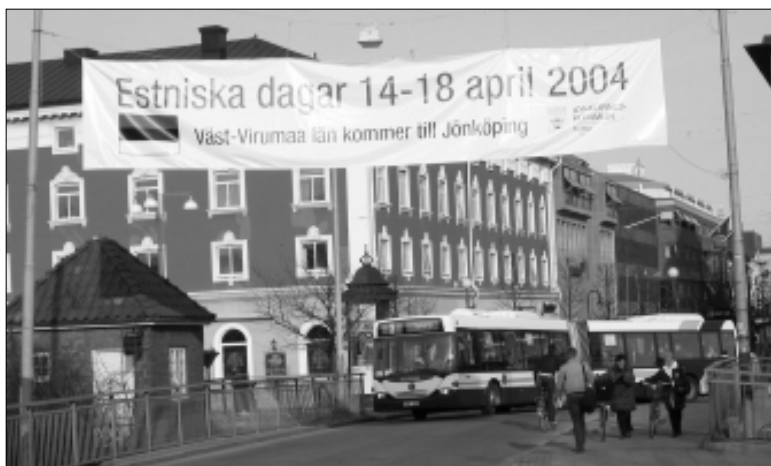
Suured plakadid andsid teada läänevirulaste rünnakust Rootsi.

Reedeõhtu meeldis mulle reserveeritud Jonköpingi Ülikooli külalastele. Vastav artikkel kultuuripäevi kajastavas rubriigis ilmub aprilli lõpus ajalehes "Virumaa Teataja". Kohalik ülikool on alles 10-aastane, kuid võitnud piirkonnas suure populaarsuse. Tegutsetakse sihtasutusena. Jõulise ees-