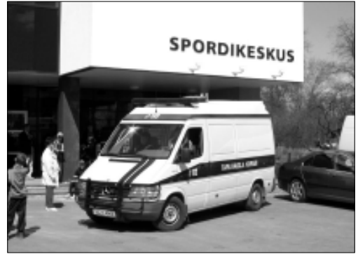
Fotomälestus eelmisel aastal toimunud turvalisuse teabepäevast.

Tulemas on Falcki mehed, kes aitavad jalakäijatel turvaliselt teed ületada ning kutsuvad neid vajadusel korrale. Kohal on Julgestuspolitsei kolme erivastuse auto ja meeskonnaga, Lääne-Virumaa Päästeteenistus, Tamrex