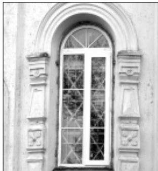
Ülemisel pildil on näha vene kiriku originaalakennt, alumisel aga juba uut plastikraamidega akent.