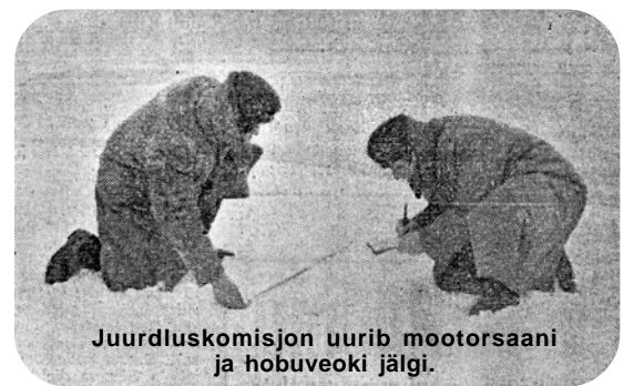
Juurdluskomisjon uurib mootorsaan ja hobuveoki jälgi.

mida mööda meie patrull liikus. Vene piirivalve oli mootorsaanil sõitnud ca 3km sügavuselt meie territooriumile, peatunud hobuveoki kõrval (jääle lumel kahe sõiduki jäljed ristuvad, peatuskohas õli-plekk ja inimeste jalajäljed) ning viinud meie mehed Vene poolele. Samaaegselt mootorsaaniga olid järvel viibinud kalurid näinud Vene poolt ka neli rege kihutavat sinna, kus mootorsaan tegeles meie piirivalvuritega. Meie piirivalvurid olid veel kontrollinud Piirissaare kalurite järvel viibimise lubasid ja vestelnud kaluritega. Mõninga aja möödudes olid kalurid kuulnud teiselt poolt piiri kaht kuulipildujavalangut. Ei olnud mingit kahtlust, et meie piirivalvurid viidi jõuga ähvardades üle piiri Vene poolele ja lasti seal maha, et lavastada piiririkumine. Eksimine on