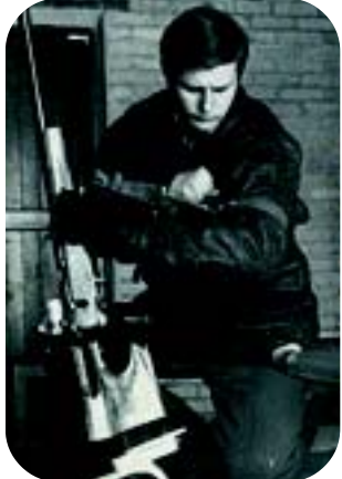
Eesti koondise treeninglaager Elvas 1968.

õveitsi need tulemused paraku ei viinud.