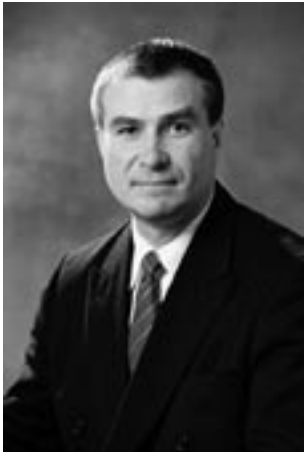
Jaan Õunapuu, regionaalminister

Inimeste vastastikune abistamine on sama vana kui inimühiskond. Läbi aegade on kohalikud omavalitsejad toetanud eakaid, haigeid, orbusid, vaeseid. Sageli on see tegevus käinud ka läbi usuorganisatsioonide.