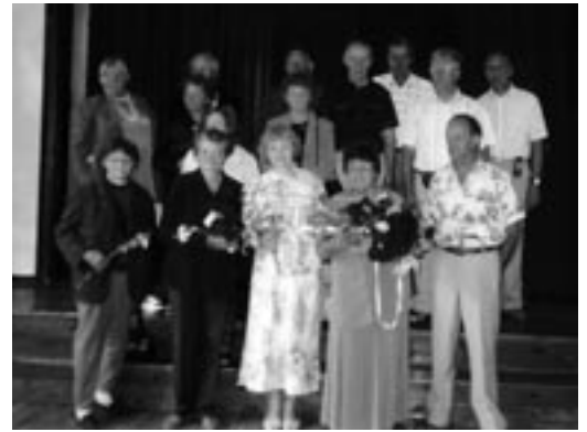
Aasta 2005