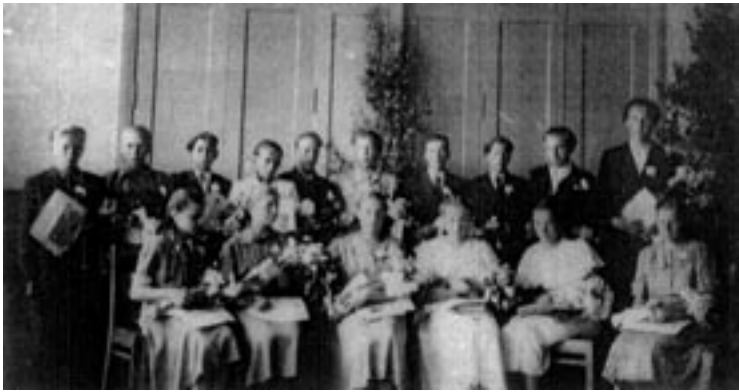
Aasta 1955