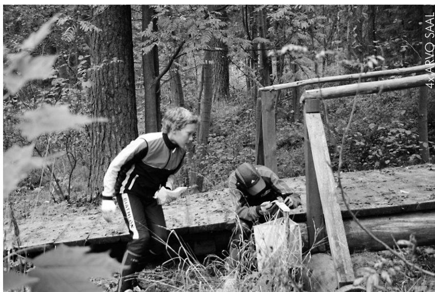
Noored orienteerujad selgitasid parimaid Valgas Priimetsas.

Võistlust toetasid Otepää vallavalitsus ja hotell Karupesa.