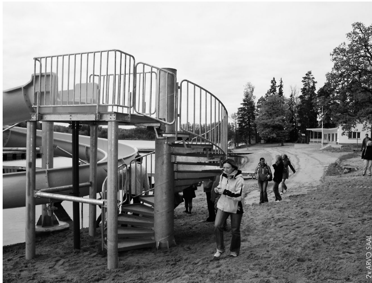
Pühajärve rannas püüab pilke uhiuus liitoru.

Tänavu käisid Pühajärve rannapargis suured ehitus- tööd, et arendada seda ala aktiivse puhkuse keskuseks. Raha töödeks saadi Phare Läänemere regiooni piiriüle- se koostöö programmist.