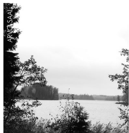
Pühajärve on Otepää pärl.