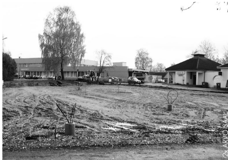
Otepää turuplatsil käivad ehitustööd.

Tehvandi suusastaadioni ilme muutub tundmatuseni.