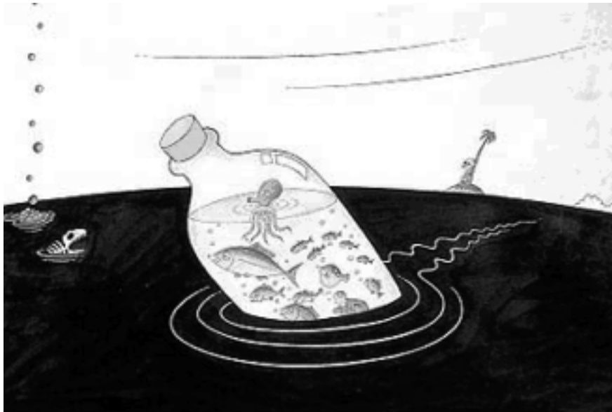
Help! The cries of fish drift over the polluted sea.