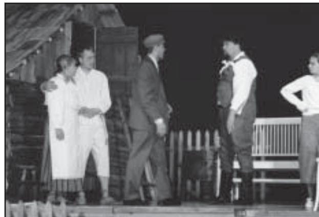
Perepoeg Enn saabus koju.