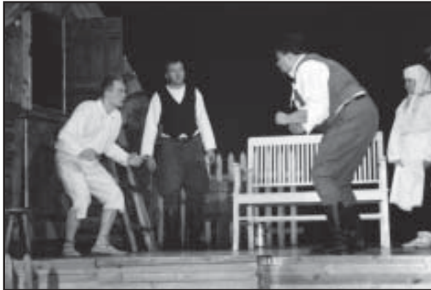
Kes on kõvem, pops või peremees?