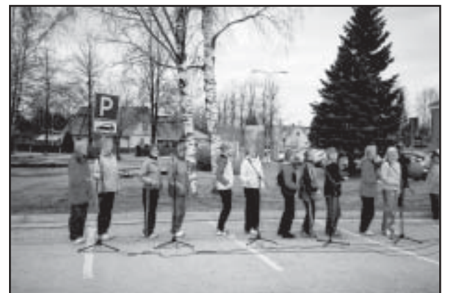
Fanni esines ka terviseaasta avamisel.