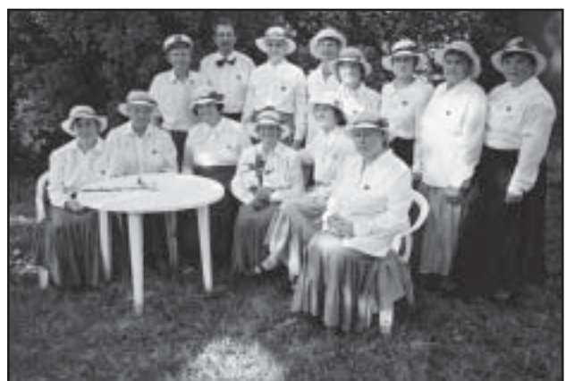
Liikumisrühm Sinililled kogu oma kauniduses.

Pidu jätkub seltskonnatantsudega. Maha peetakse Sinililledele sõda ja võisteldakse tantsimises. Parimatele jagatakse meeneid.