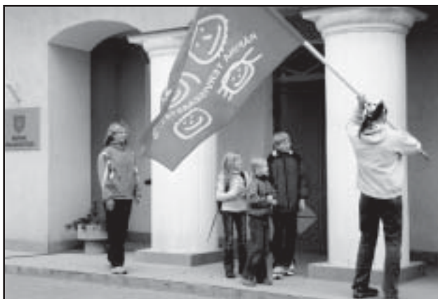
Perekond Junson terviseaasta lippu heiskamas.

Varakevadiselt jahedal ja tuulisel 7.aprilli õhtupoolikul kogunes vallamaja ette kenake hulk huvilisi, et osa saada Rääpina terviseaasta väljakuulutamisest.