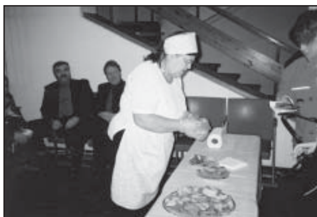
Etenduse vaheajal sai puhvetist osta omaküpsetatud leiba ja maasinki.