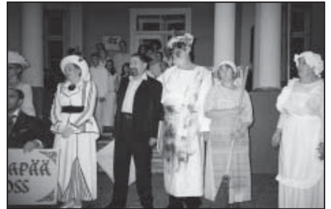
Hetk eelmise suve vabaõhuetendusest „Sillapää Ossi kronika“.

19.märtsil käisid Räpina vallas tegutsevad näitetrupid Vastseliinas maateatrite päeval, millest võtsid osa kolme Lõuna-Eesti maakonna - Võru, Valga ja Põlva teatrimängu harrastajad.