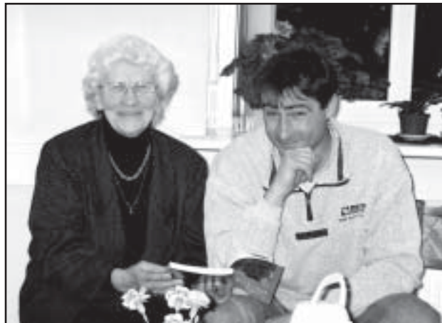
Kui võtaks kätte ja vallutaks järgmiseks Naruskimäe...

Tunnen ikka, aga väiksematel kõrgustel, kus mõte veel töötab.