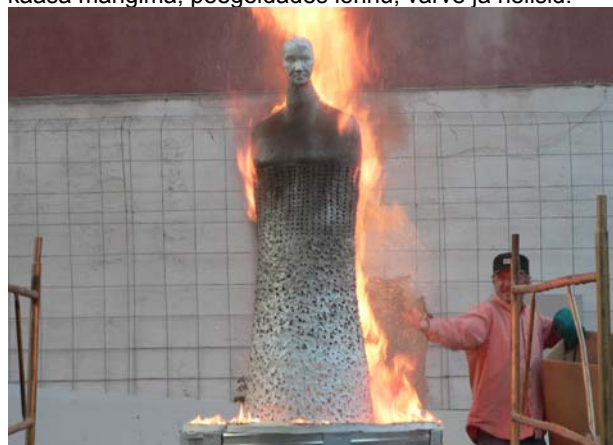
"Põhjataeva peegeldused" Sagadis. Keraamikute suur skulptuur, valmistati Eestis esmakordselt.

Graafikas kasutati eredat päikesevalgust, mille abil kopeeriti eriliste tehnikate abil kujutisi erinevatele materjalidele. Kasutati nii maalitud kangast, fotosünteesis töid, kuid ka paberist suuremõõtmelisi objekte. Kahjuks ei õnnestunud tehnilistel põhjustel "trükkimine" päikesevalguse abil kividele, sest materjal osutus liiga poorseks ja imendumine polnud see, mis algselt loodetud. Kuid siiski õnnestus kunstiprojekti käigus valguse ja varju abil kujutisi erinevatele materjalidele kopeerida, ühendades ehedaid looduslikke taustu meid esiplaanil saatva tehnoloogilise ja kunstlikuga. Kasutusel olid paber, puu, tekstiil, vaha, fotokemikaalid, metallplaadid jpm. Trükiti metallplaatidele loodust ennast – liblikaid, lilli aga ka objekte. Kuna graafika oli välja pandud Viinistu Kunstimuseumis, siis hoolimata tööde spetsiifikast (trükiti ka meega) hakkas kõrge näituseruum kaasa mängima, peegeldades lõhnu, värve ja helisid.