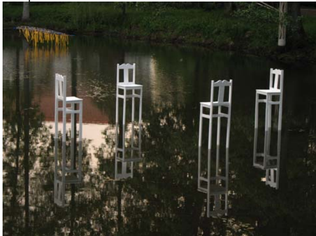
"Põhjataeva peegeldused" Sagadi tiigil.

Eesti Kultuurkapital; Hasartmängumaksu Nõukogu Kuninglik Norra Saatkond; Kuninglik Taani Saatkond Põhjamaade Ministrite Nõukogu esindus Eestis; MTÜ Fenno-Ugria Asutus; Sagadi RMK; ES Sadolin AS; Husqvarna Eesti OÜ.