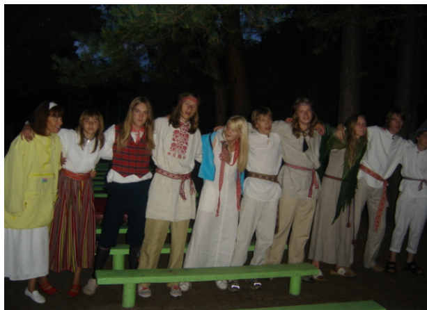
Sume laagriõhtu Marimaal pärast kontserti.

Tervituskõne lõpetasime me sooviga, et kõik soome-ugri lapsed hoiaksid oma keelt ja kultuuri. Andsime üle suure ümmarguse musta leiva, ühtlasi selgitades, mida eestlastele leib tähendab ja on aegade jooksul tähendanud. Sellest leivast said osa kõik, kes kohal viibisid. Igaüks sai murda endale tükikese ja kõigile maitset väga.