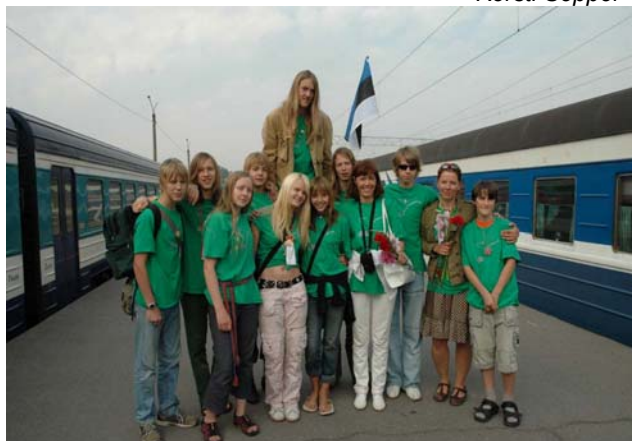
Õnnelikult tagasi Marimaalt