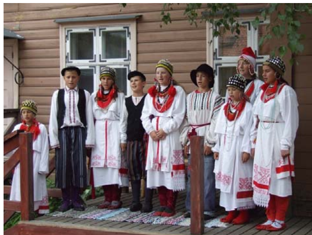
Vadja ansambel Linnud Tartus Tampere Maja hoovis