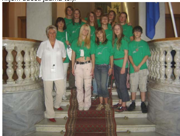
Eesti Saatkonnas Moskvast

Kui olime jõudnud tagasi Joškar-Olasse, tehti meile ka linnaekskursioon. Nägime tundmatu sõduri hauda ja Suure Isamaasõja monumenti. Siis algas aga tagasitee raudteejaama ning kojusõit. Meie Moskvasse saabudes oli meil vastas Eesti saatkonna buss, mis meid saatkonda sõidutas (ning hiljem uuesti jaama töö).