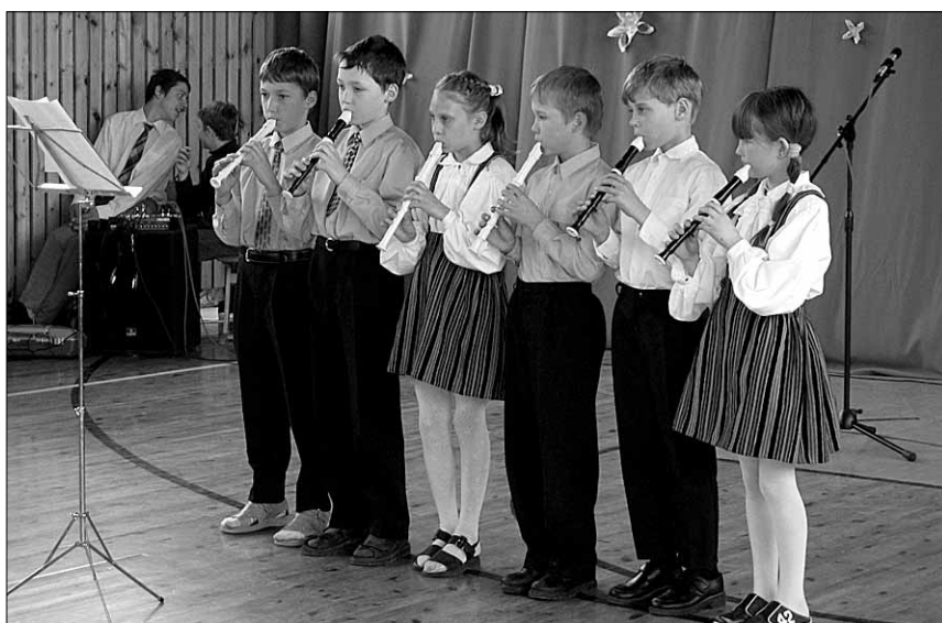
● Esinevad Kalmetu noored plokkflöödimängijad.