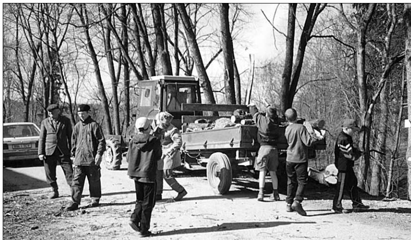
● Tööd jätkus Tusti pargis mitme põlvkonna esindajatele nii teeaertes kui oru põhjas.