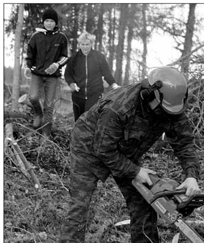
● Pärast Ruudiküla padriku maha-võtmist saab aimu mänguväljakuks mõeldud maa-alast.

Tustilaste kõrval oli talgulisi naaberküladest Uusnast, Kalmetult ja Survast. Oli nii lapsi, keskealisi kui pensionäre – tegemist jätkus kõigile. Saemehed tükeldasid langenud tüvesid ja laasisid oksa. Süüdati palju lõk-