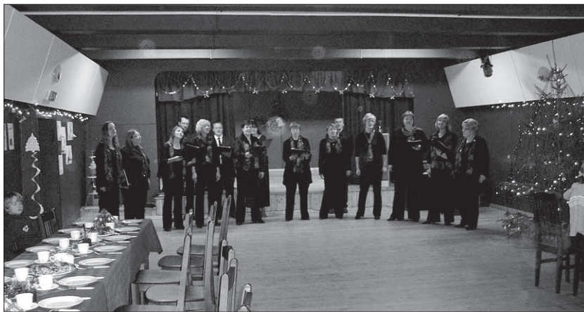
● Tánassilmas oli meeoleukas pensionäride jõulupidu.

Külas oli Pärsti naisansambel „Olla Daam“ Toomas Volli juhendamisel. Külalistega vaheldumisi esinesid väikesed lauljad lasteringist „Lepatriinud“, mees trio ja tantsuansambel „Kaheksa-