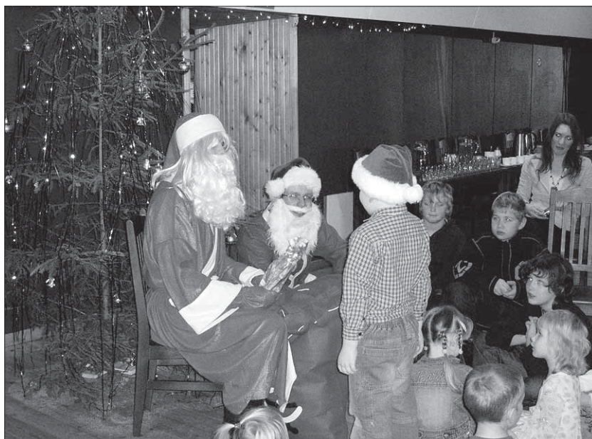
● Laste pidu üllatas kahe jõuluvanaga.

Viiratsi võistkond osaleb "Maakilvas" teist aastat. Tänavu on võistkond väljas