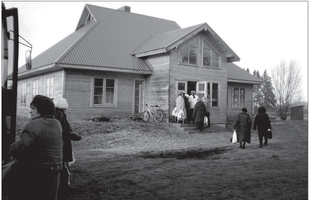
● Soometsa külamaja võtab Tänassilma taidlejaid lahkelt vastu.