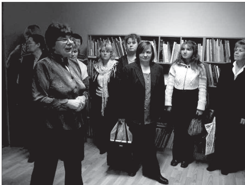
● Raamatukogutöötajad on kokku hoidev rahvas.

Ei kutsu enam kauged maad, neid nähtud omajagu. Mu meeli köidab tähisöö ja hommikune agu. Kaunist jõuluaega!