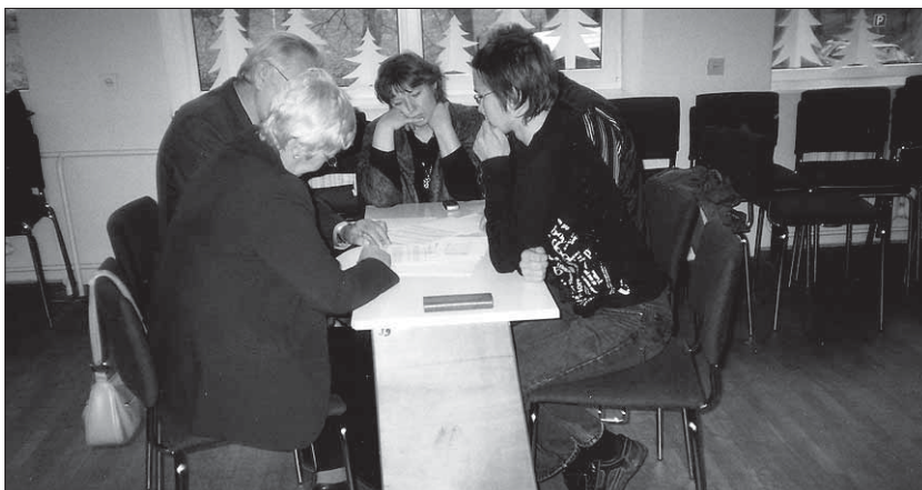
● Viiratsi Kilvarid murravad pead.