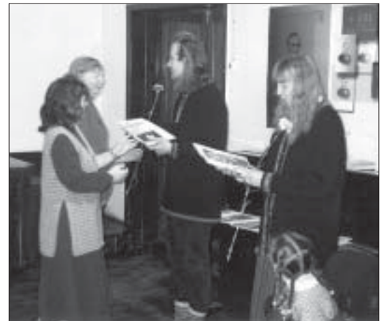
KORRALDAJAD TÄNAVAD KÜLALISESINEJAJAID