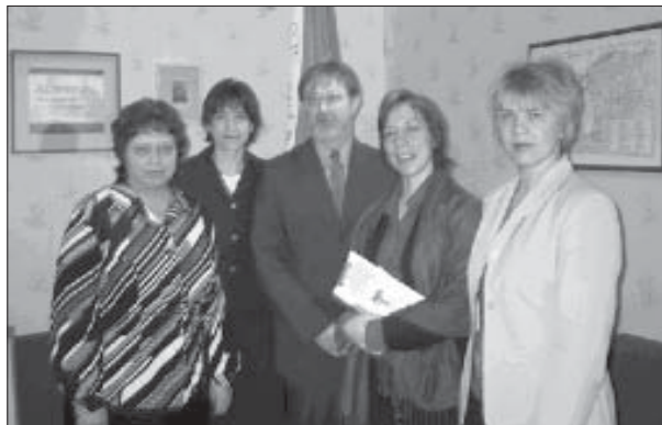
HARIDUSMINISTER MAILIS RAND PUHJA GÜMNAASIUMIS