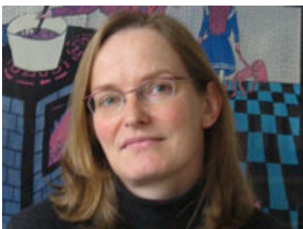
KATRIN SCHÄFFGEN ROSA LUXEMBURGI FOND

Sarnasused ja erinevused 25 Euroopa Liidu liikmesriigis