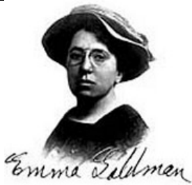
EMMA GOLDMANI 1935. A.A. ILMUNUD ARTIKLI II OSA

Pöörame nüüd pilgu tootmisele ja tarbimisele, igasuguse eksistent-si aluseile. Ehk leiame siin kröömikesegi kommunismi, mis õigus-taks lõpuks ometi Venemaal valit-seva korra nimetamist kommu-nistlikuks, vähemalt karvavõrragi.