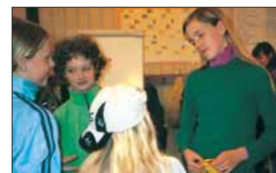
Rollimängudes õpiti uimastitega seotud teemadel arutlema ja õigeid valikuid tegema.