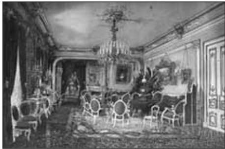
Saal vanas peahoones, tundmatu kunstniku akvarell, 1860ndad.

Revolutsioonijärgselt Venemaalt põgenes Eestisse paremaid aegu ootama baltisaksa sidemetega härrasrahvast, kes siinsete mõisate ellu uut ja omamoodi värvingut tõi. Kumnasse koondus venestunud Meyendorffide hõimukoloonia, kus võeti lahkelt