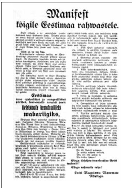
1918. aasta veebruaris levitatud "Manifest

kõigile Eestimaa rahvastele" kuulutab Eestimaa tema ajaloolistes ja etnograafilistes piirides iseseisvaks demokraatlikuks vabariigiks. 87 aasta vanune dokument pole vaatamata oma kõrgele eale aktuaalsust kaotanud ka täna. Manifest kuulutab Eesti Vabariigi poliitiliselt erapooletuks ning sätestab Ajutise Valitsuse juhtumõtted (kodanike kaitse vabariigi seaduste ja kohtute ees, kodanikuvabadused, korralduse ning seaduseelnõude välja töötamise). Manifest lõppeb sõnadega: "Eesti! Sa seisad lootusriikka tuleviku lävel, kus sa vabalt ja iseseisvalt oma saatust võid määrata ja juhtida! Asu ehitama oma kodu, kus kord ja õigus valitseks, et olla vääriliseks liikmeks kultuurrahvaste peres! Kõik kodumaa pojad ja tütreid, ühinegem kui üks mees kodumaa ehitamise pühas töös! Meie esivanemate higi ja veri, mis selle maa eest valatud, nõuab seda, meie järeltuljad põlved kohustavad meid selleks. Elagu iseseisev demokraatlik Eesti Vabariik. Elagu rahvaste rahu!" Allkiri: Eesti Maapäeva vanemate nõukogu, veebruar 1918.