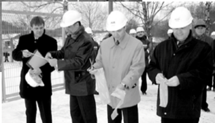
Otepää vallavanem energeetikute ja ehitajate esindajatega vastse alajaama linni läbi lõikamas.

Otepää areng on viimasel kümnendil olnud aktiivne. Tänu elukeskkonna ja infrastruktuuri taseme tõusule on hoogustunud elamuehitus ja kinnisvara arendamine.