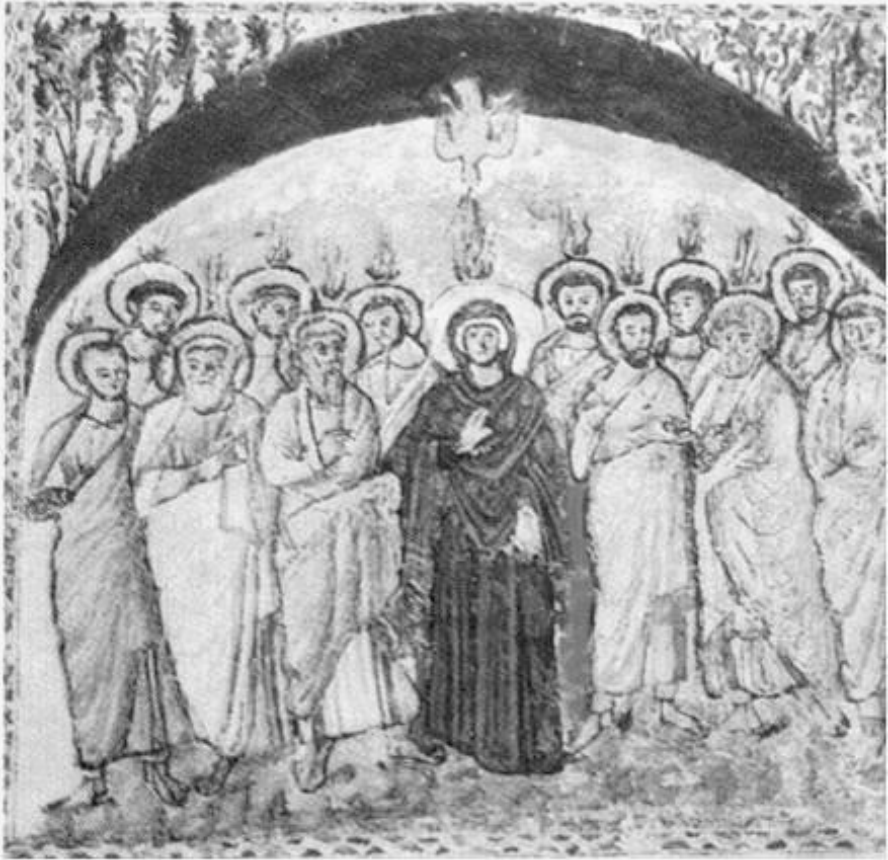
Püha vaimu väljavalamine