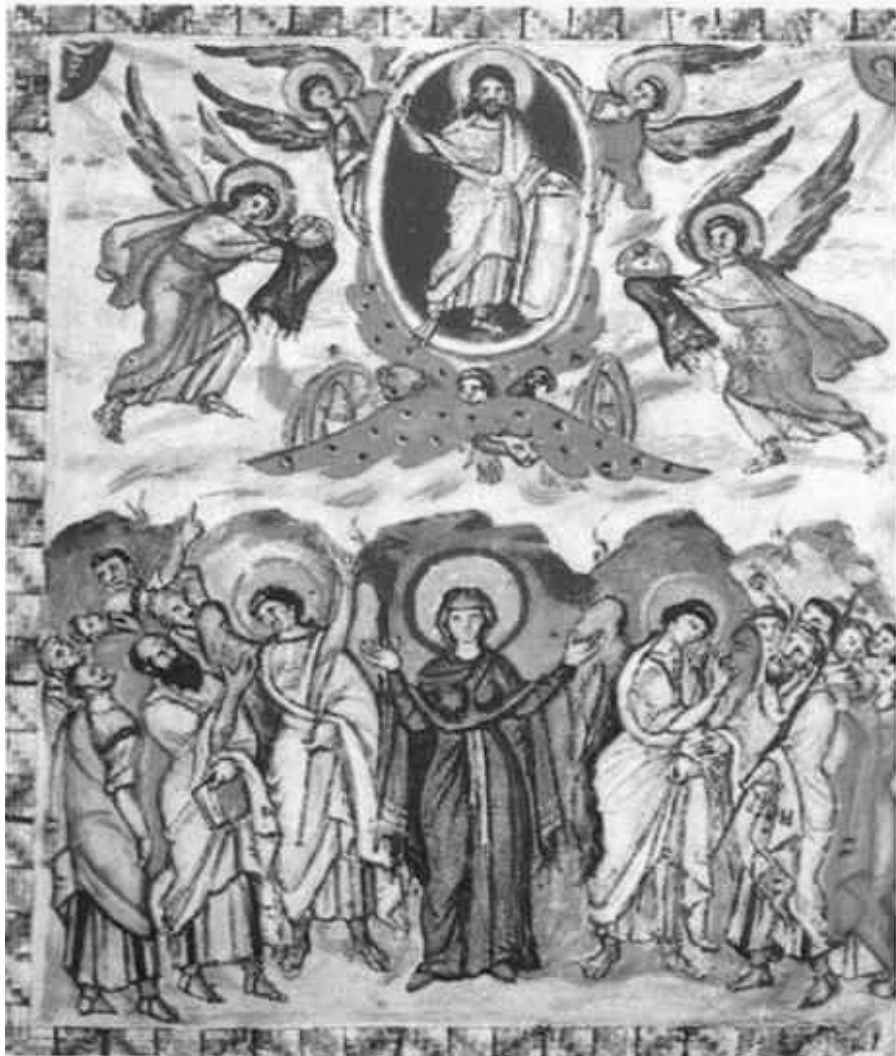
Rabbula VI saj