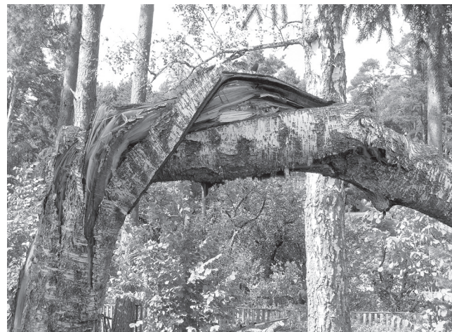
Tormi kunstitöö – väändunud kasetüvi Puiestee tänavas.

“Esmaspäeval suutsime neljaks tunniks generaatori pealt vee tagasi anda,” seletas linnapea. “Generaatori abil vee andmine päev läbi oli komplitseeritud ja raske, seetõttu saime vett anda loetud tundi-kaupa. Veega varustamine taastus linnas orienteeruvalt kell kaheksa öhtul.”