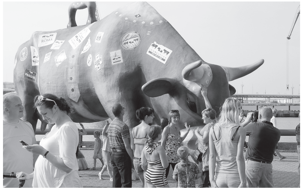
Ilma end hiiglasliku lehma taustal pildistamata ei lahu siit linnast küll ükski turist.