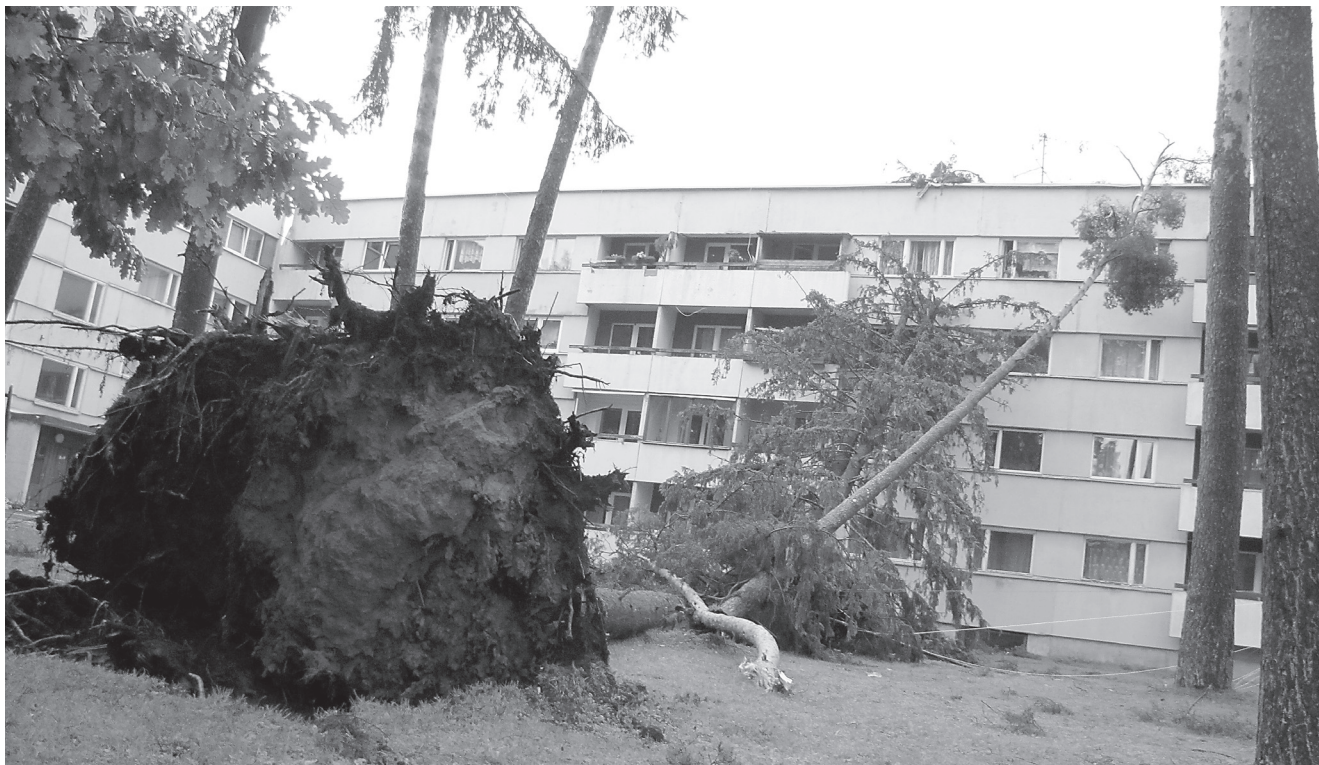
Nooruse 13 korterelamu peale langetas raju kolm suurt puud. Purunes üks aken ning kannatada sai maja katus.