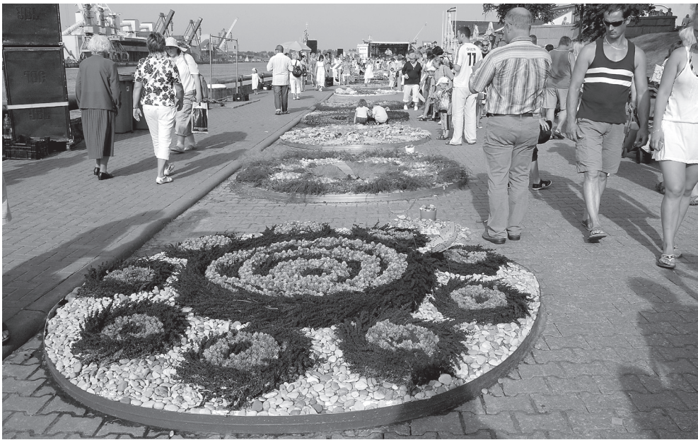
45 suurt lillevaipa Venta jõe kaldal tekitasid vaatajais ohoo-elamuse.