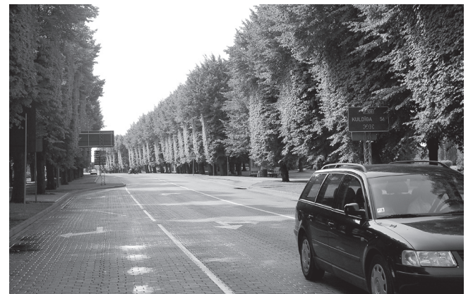
Lisaks sellele, et kahelt poolt sirgelt pügatud suured pärnad jätvad mulje, nagu viibiksid kusagil eksootilisel maal, on neil ka teine eesmärk – nii ei varja suured puud valgust.