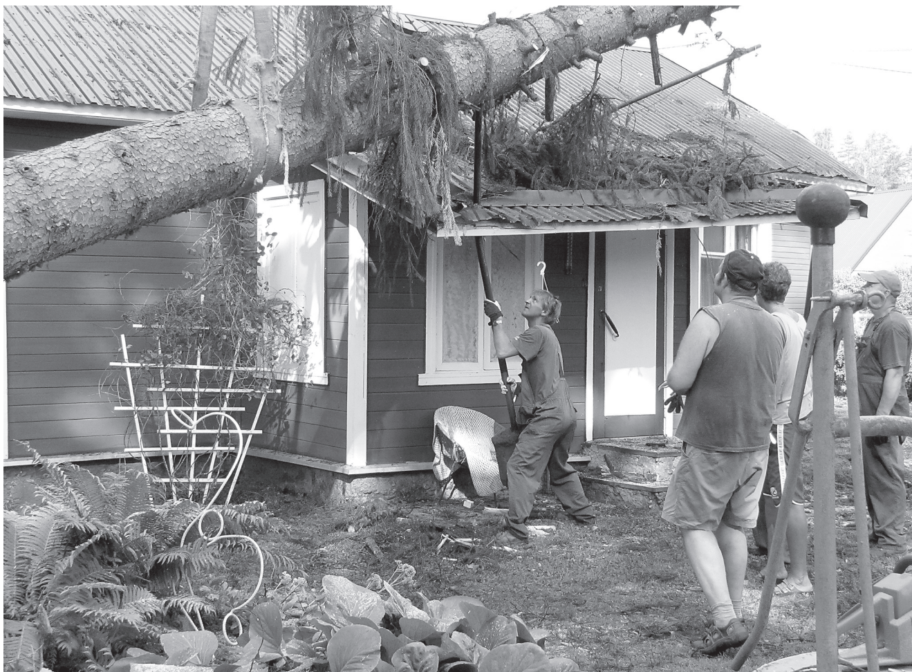
Hiiglasliku kuuse alla jäänud Tartu maantee 44 maja päästis täielikust purunemisest puu tüvesse tunginud tuulekoja katuse tugipost.