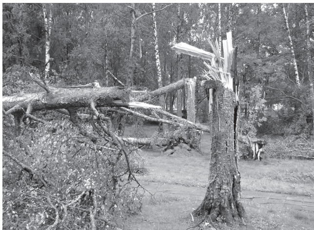
Tormi murdis kased raudteejaama pargis.