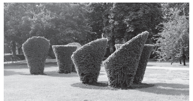
Fragment ühe pargi haljastusest.