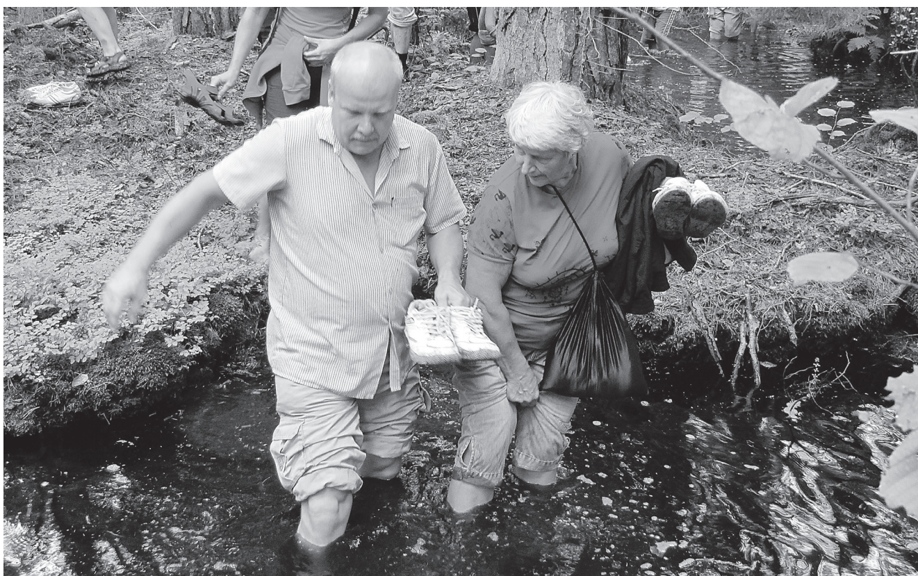
Lodumetsas lodistades tuli jalanõud näppu võtta.