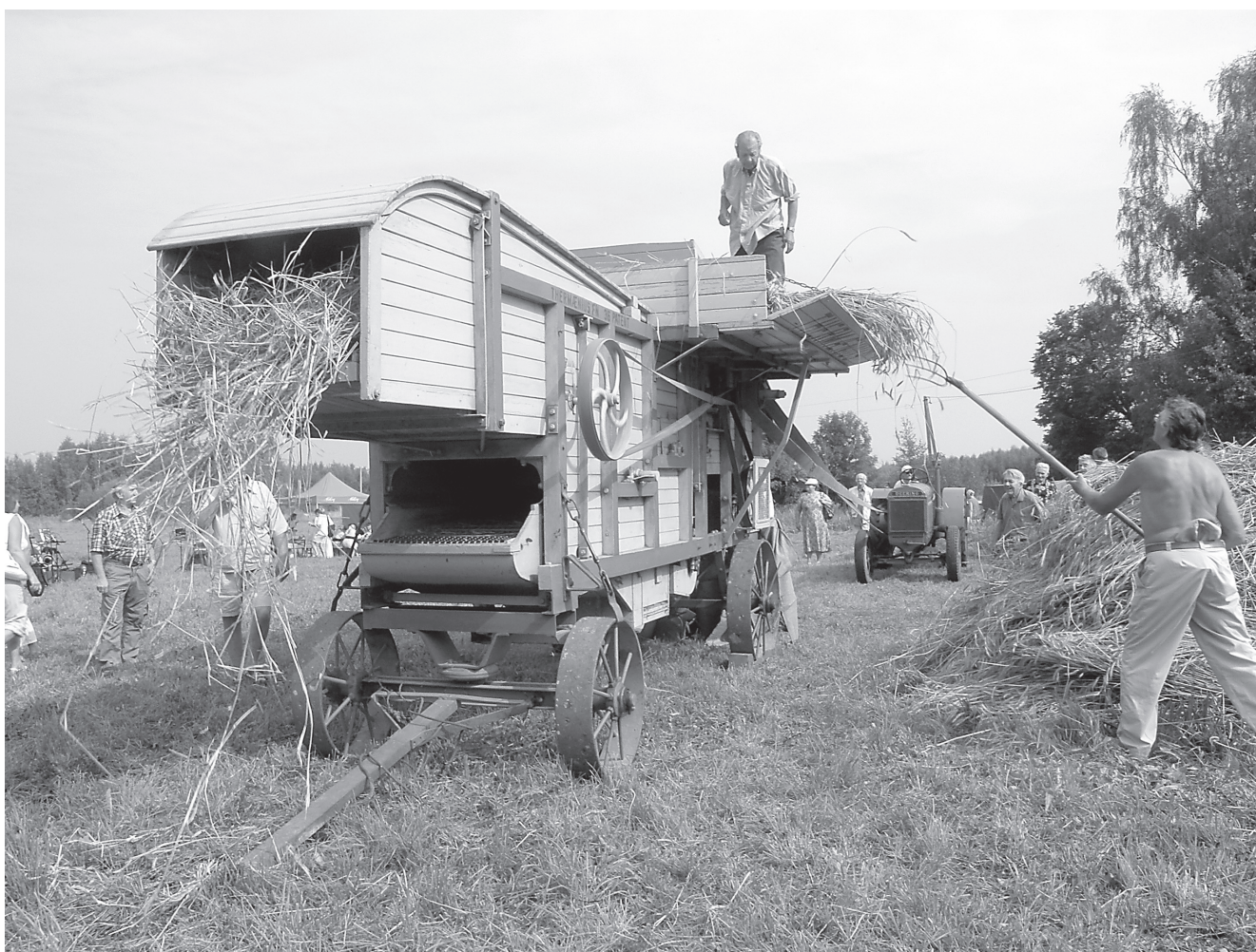
Nii peksti reht vanasti ja tehakse seda ka praegu.