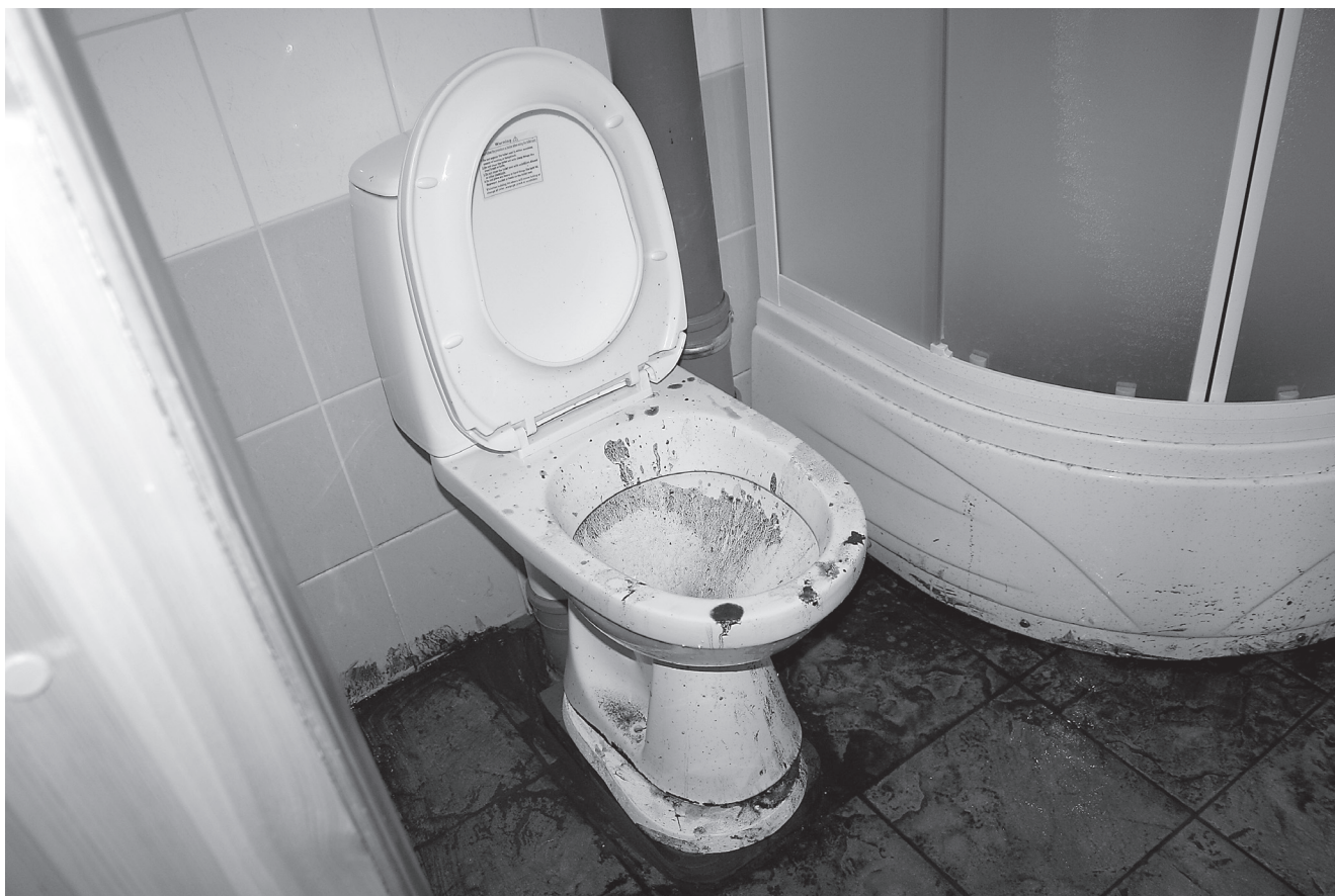
WC potist üle ääre ajanud kanalisatsioon ujutas üle kogu maja alumise korruse.

"Sest meie maja on trassi kõige madalamas otsas," selgitas Kruusna. "Siiani probleemi ei olnud, sest maja ei olnud kanalisatsioonitrassiga veel ühendatud. Tegelikult aga esines probleem juba mitmeid kordi varem. 20. mai õhtul kella kolmveerand kaheksa ajal purskas Tartu maantee 18b ja 18c maja vahel olev kanalisatsioonikaev oma fekaalid kahe ja poole meetri kõrgusele. Too-