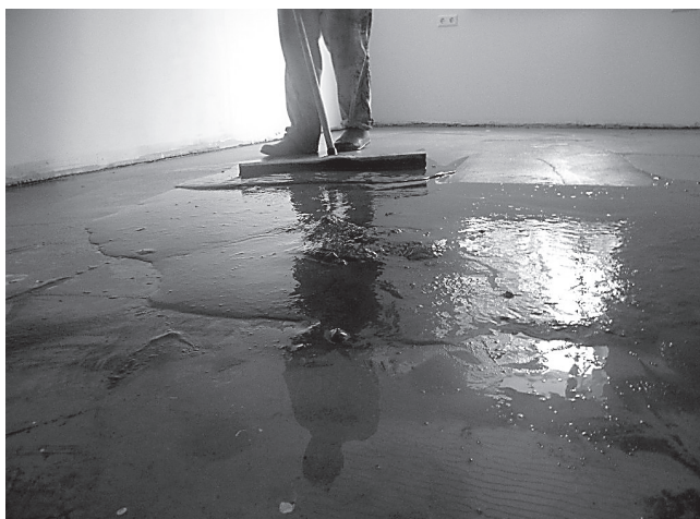
Kes koristab elamise järgmisel korral, kui tuleb suur vihma sadu? Kas majaomanik või Emajõe veevärk?

na kohale tulnud järelvalveametnik süüdistas antud trassi ääres olevaid majasid oma heitvete maha laskmises. 22. mail pandi pumpla uuesti tööle, kuid heitveed kahe nimetatud maja vahel voolasid edasi. Viga oli siiski projekteerimises, kuna trassile polnud ette nähtud tagasilöögi klappi.