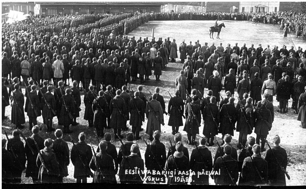
Pildil Eesti Vabariigi aastapäeva paraad Võrus 1920. aastal.