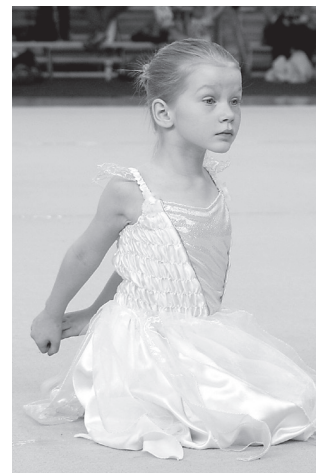
Kõik algab sirutusest – juba pisikesest peale.

Päeva teises osas, liikumisrühmade festivalil "Kõik algab sirutusest" esitasid klubide, studiot, lasteade- ja koolide mudilas-, laste- ja noorterühmad kokku 34 erinevat kava. Elva RN studiodist oli esinemas koguni seitse tantsurühma. RN studio noorterühm sai tantsulisema grupi eripreemia kavaga "Freaky". Tunustuse pälvis ka studio poistetruup. Noorte rühmade arvestuses jagasid RN studio poisid ja noorte rühm kolmandat kohta.