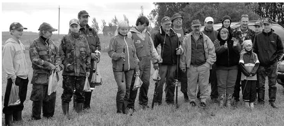
Kalapüügivõistlusel osalenud oma saagiga