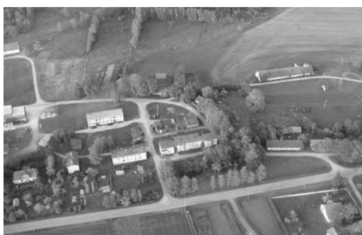
Vaade Roosnale taevast