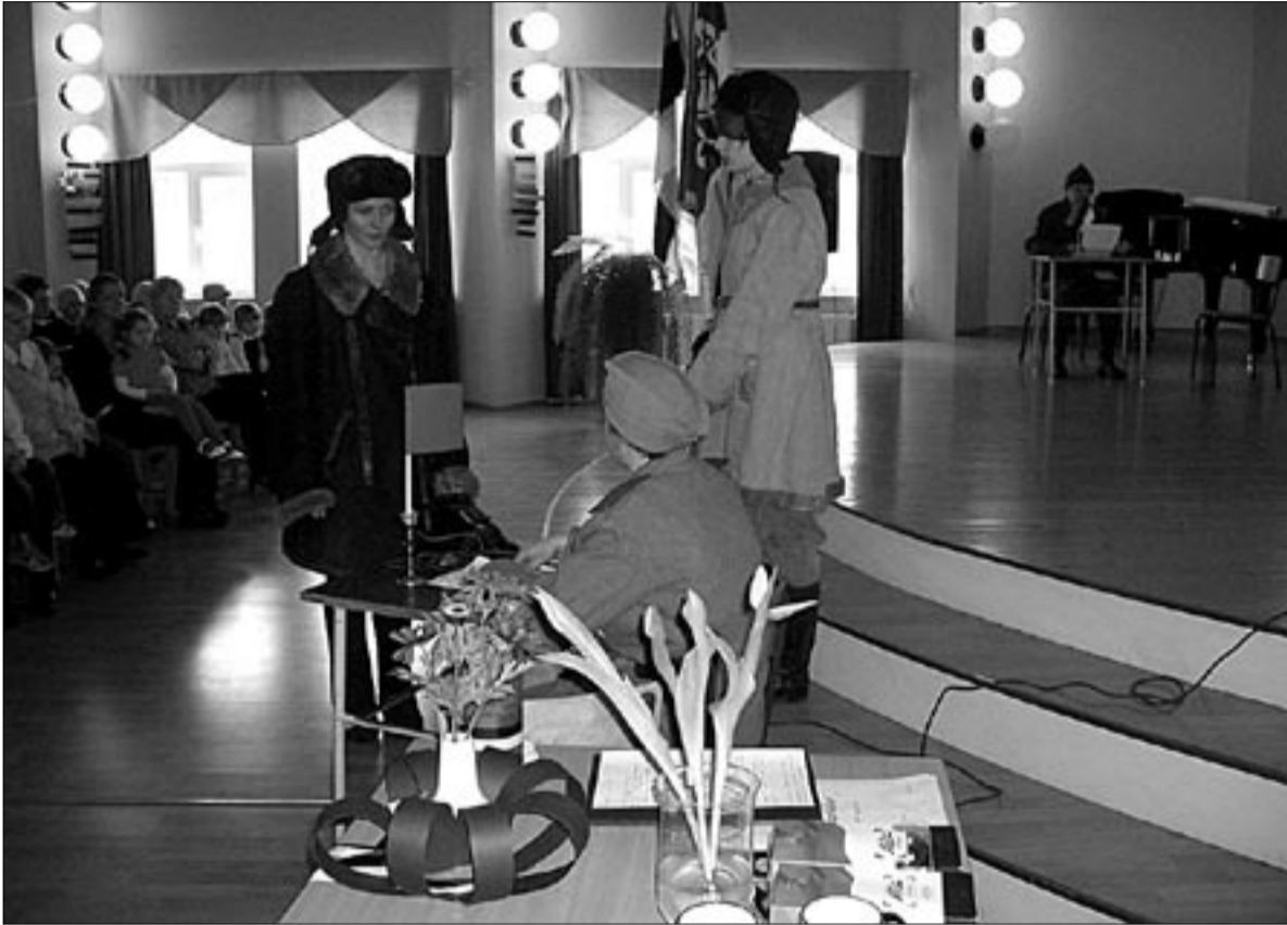
● Halliste kooli ajalooringi etendatuna elustus koolis iseseisvuspäevaaktusel episood punavägede väljatõrjumisest Karksi mailt 1919. aastal.