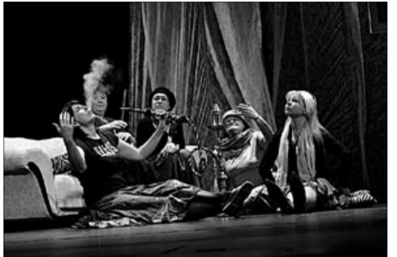
● Abja Gümnaasiumi õpetajate ja vilistlaste näitetrupi etendus “Koristajad” pälvis õpetajate üleriigilisel teatrifestivalil “Sillad” preemia nii noorte kui täiskasvanute žüriilt.