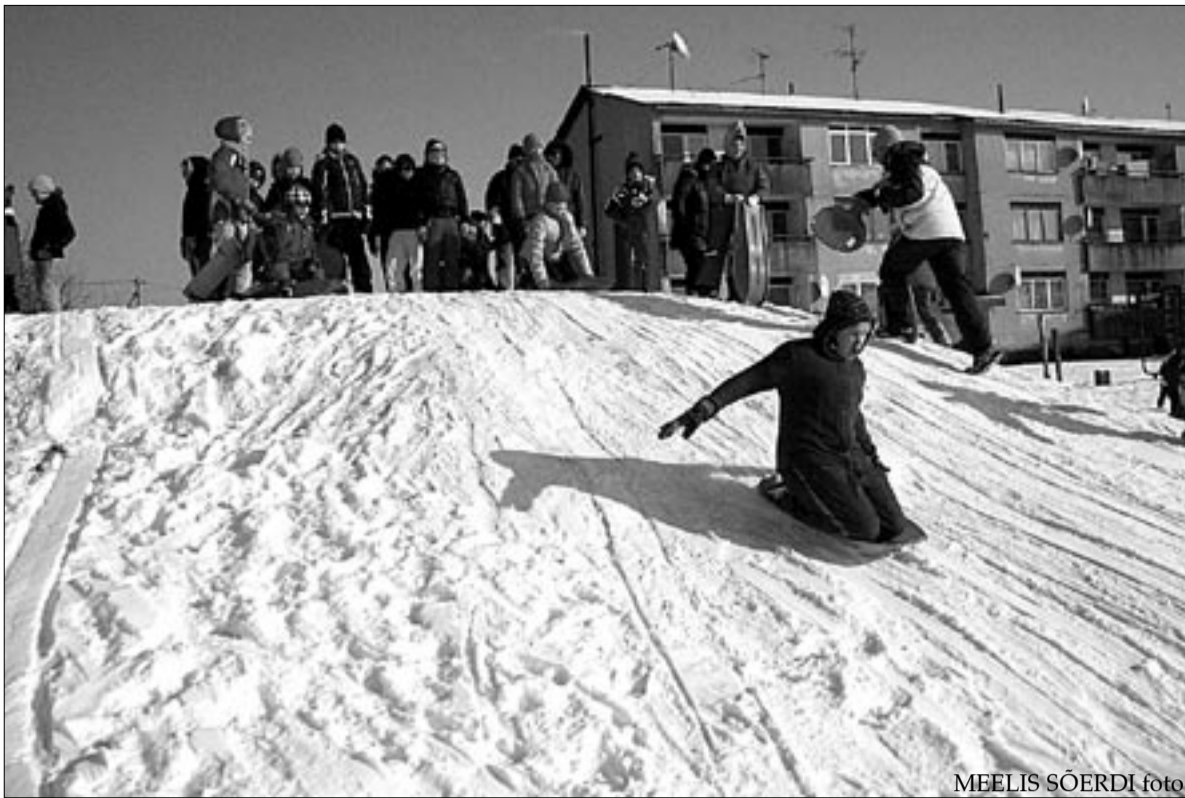
● Kamaral võistlesid ühisel vastlapäeval liumäel pikima liu laskmises lisaks kohalikele ka Abja lapsed.

Vana-Karistes tähistasid vastlapäevalised esmalt hommikul Eesti Vabariigi aastapäeva, lauldes seltsimajas