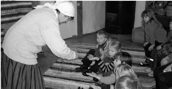
Tadi Els ja Mesimummi lapsed Aravete Külamuseumis