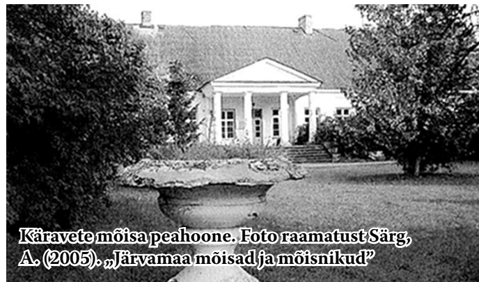
Käravete mõisa peahoone.

Prouale meeldinud väga lilled, mistõttu mõisa taha suured uhked kivist lilleklumbid ehitati (mis küll tä-