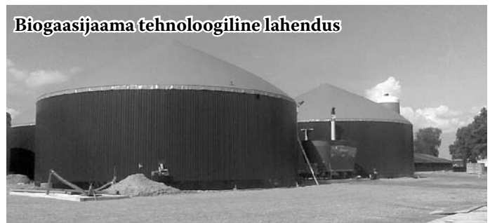
Biogaasijaama tehnoloogiline lahendus

Positiivsetest keskkonnamõtjudest on peamised Mägise Suurfarmi kesk-