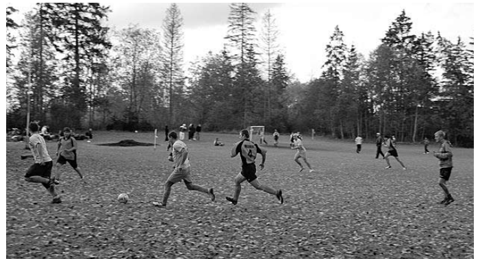
Ambla Külaliiga jalgpallturniiri peeti üheks paremaks kohalikuks spordisündmuseks 2008. aastal

Alates jaanuarist on Aravete Spordihoones avatud ka laupäeviti kell 12–15 .