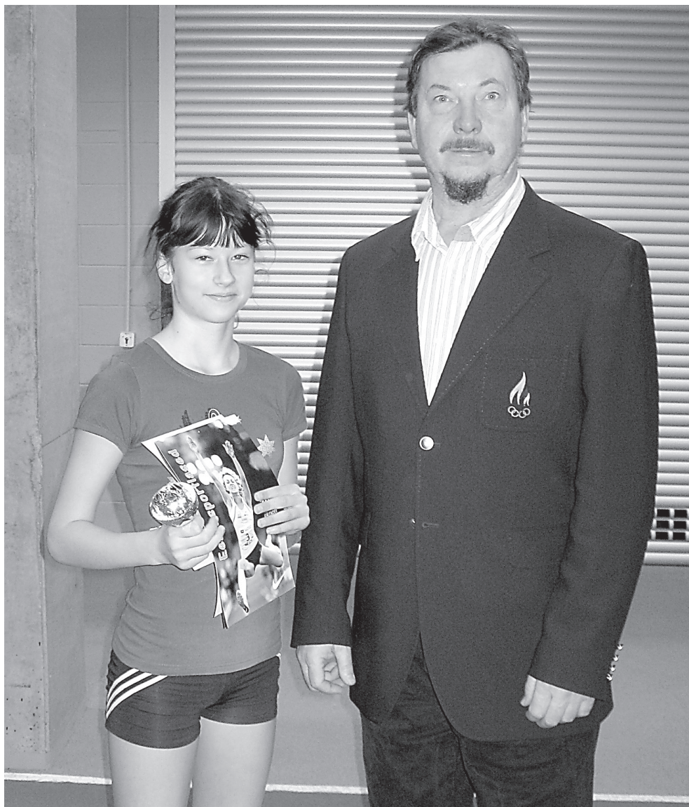
Kalli Kuusik koos olümpiavõitja Jaak Uudmäega.