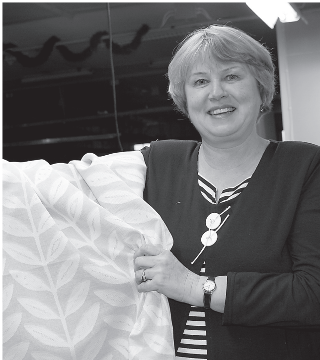
Pille Abeli käes olevast kaunistriilise kangast ömmeldakse Elvas dekoratiivkardinad. Kuhu need aga müüki lähevad, on firmajuhi otsustada.

Kuigi tundub uskumatu, aga jõululaupäev oli