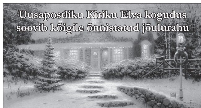
Uusapostliku Kiriku Elva kogudus soovib kõigile õnnistatud jõulurahu