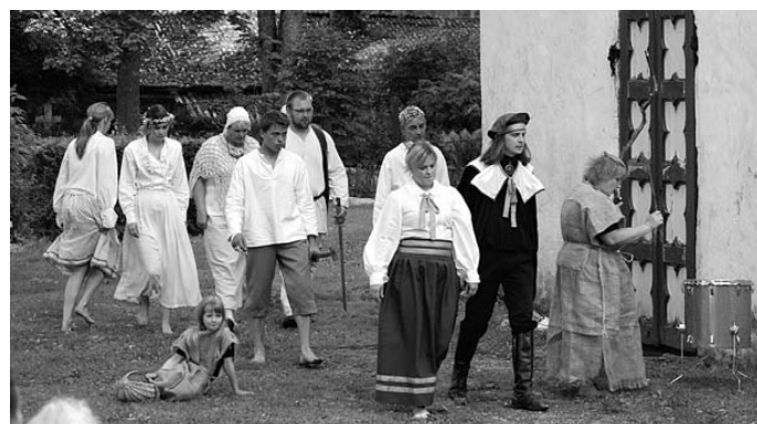
Ambla näitering esitas legendi Ambla kiriku ehitusloost