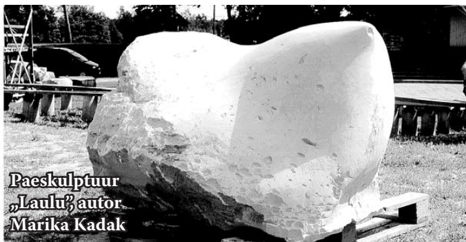
Paeskulptuur „Laulu” autor Marika Kadak

Juuli alguses Paides toimunud rahvusvahelistel Paepäevadel valminud skulptuurid kinkis Paide linn Järvamaa omavalitsustele.