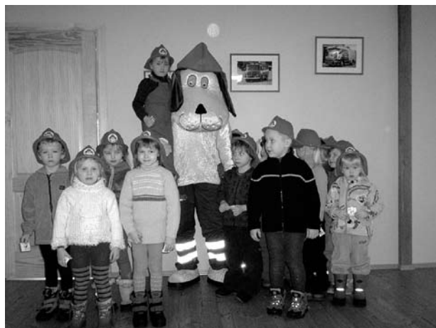
Keskmise rühma lapsed Nubluga